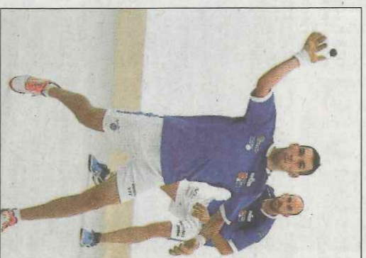
Loria d'Alzira, ahir a Pelayo. VN

Els tres rojos començaren al mateix nivell que els rivals, inclús un poc millor, perquè aconseguien el joc del dau amb més solvència. Però després de la igualada a 10 van per-