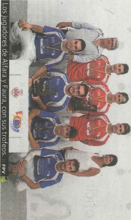
Los jugadores de Alfara y Faura, con sus trofeos.

El Individual de raspall también alcanza los cuartos y, con ellos, el momento de la entrada en liza de los favoritos. Moltó inicia su camino hacia el Fris Grec –será suyo si vuelve a ser campeón– el domingo contra Guadi. Ian, posiblemente su gran rival por el título, debuta el lunes contra Josep. También es atractiva la partida del sábado: Marrahí, vuelve al mano a mano, torneo que ganó en 2014 antes de padecer un calvario con las lesiones.