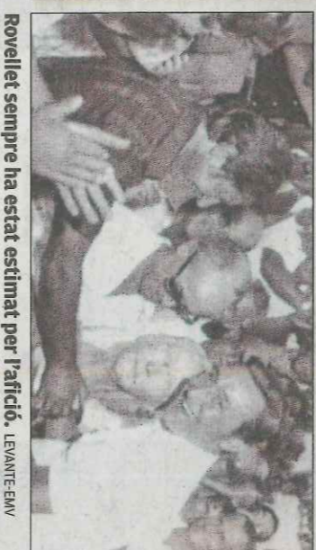
Rovellat sempre ha estat estimat per l'afició.