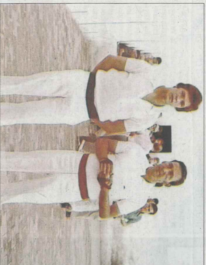
L'inici del Genovés va coincidir amb els darrers anys de Rovellat. FPV