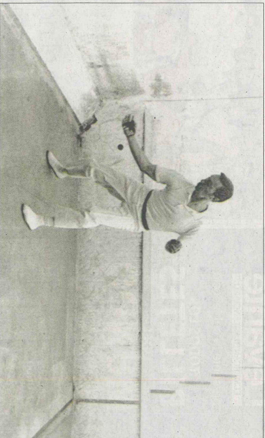
Rovellat va destacar pel seu estil de joc elegant i la seua presència, sempre impol·luta. FPV