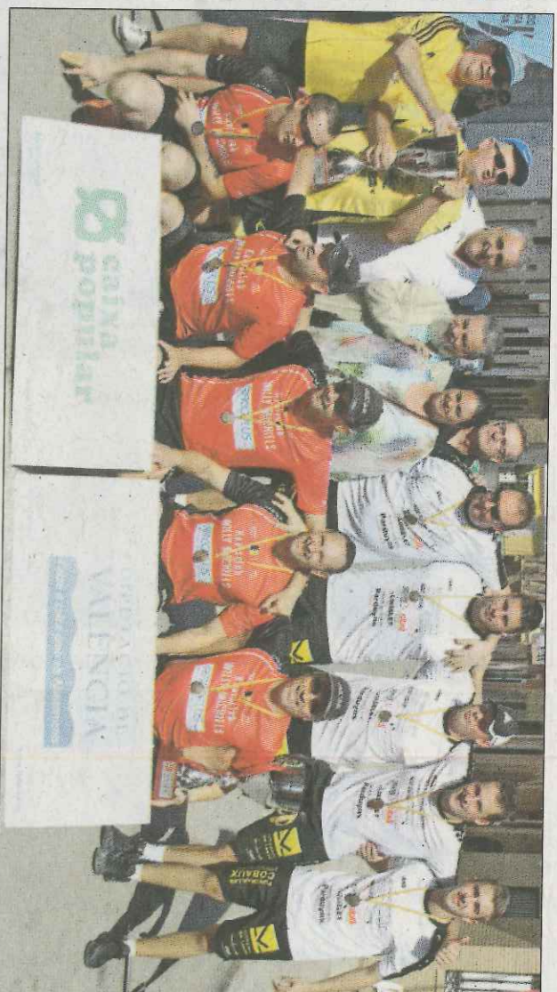
L'equip belga va vencer ahir a Godella.