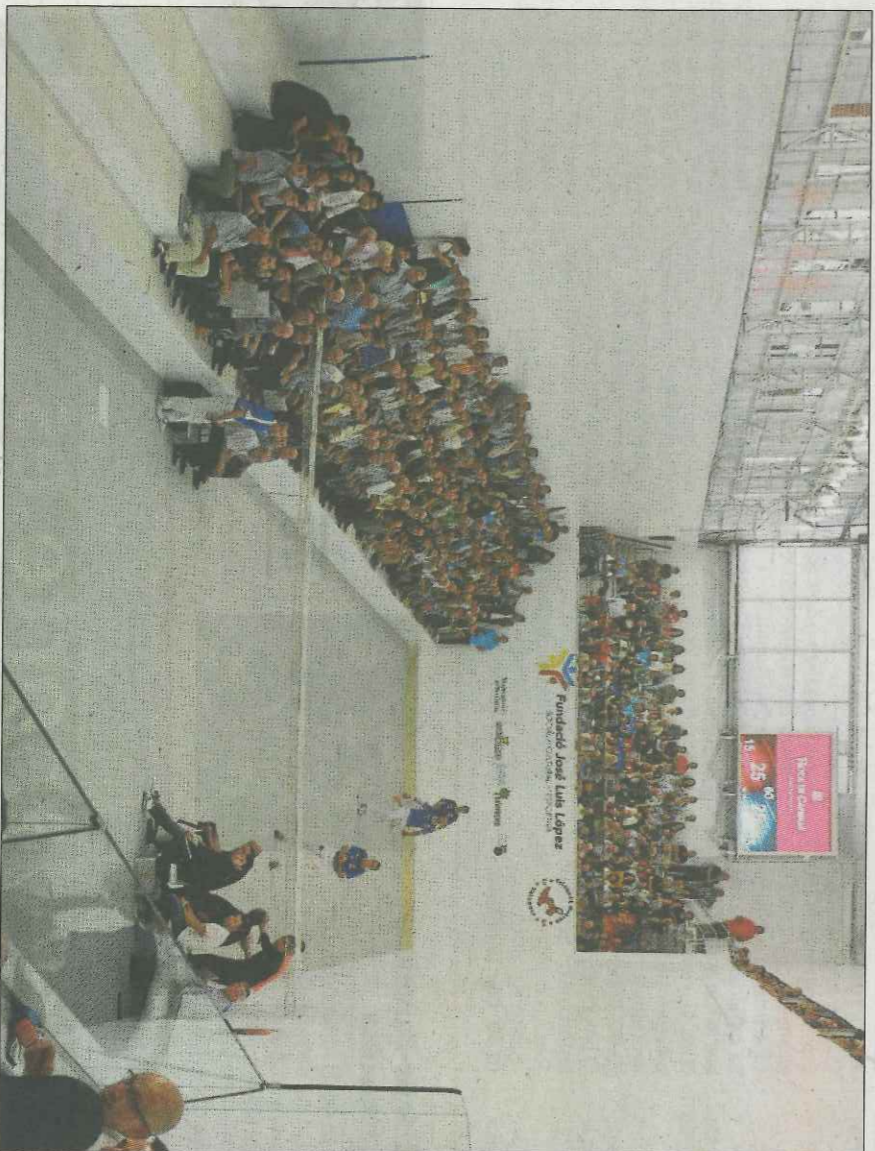
Feia anys que no es veia la imatge del públic passant la corda. VAL NET

Amb 15-10 en contra, Coeter II va tenir val-15 en un joc llarguíssim que finalment va ser per a Josep. El de Sinat va acusar després l'esforç. Ian espera ja al pilotari de Xeraco.