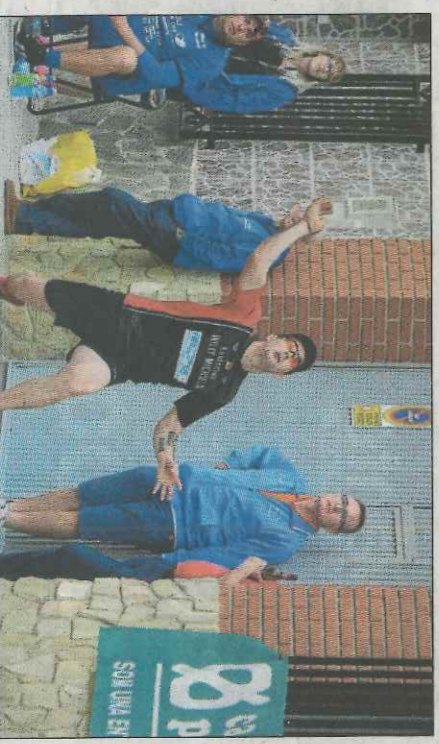
Una instantània d'una partida jugada aahir.

Els dos equips Belgues han ocupat la primera plaça dels seus respectius grups de competició, mentre que els dos equips espanyols han accedit a semifinals com a segons de la fase de grups. En el grup A, ha acabat com a primera classificada la formació de Thieulain qui ha guanyat els seus tres compromisos amb un joc molt solvent.