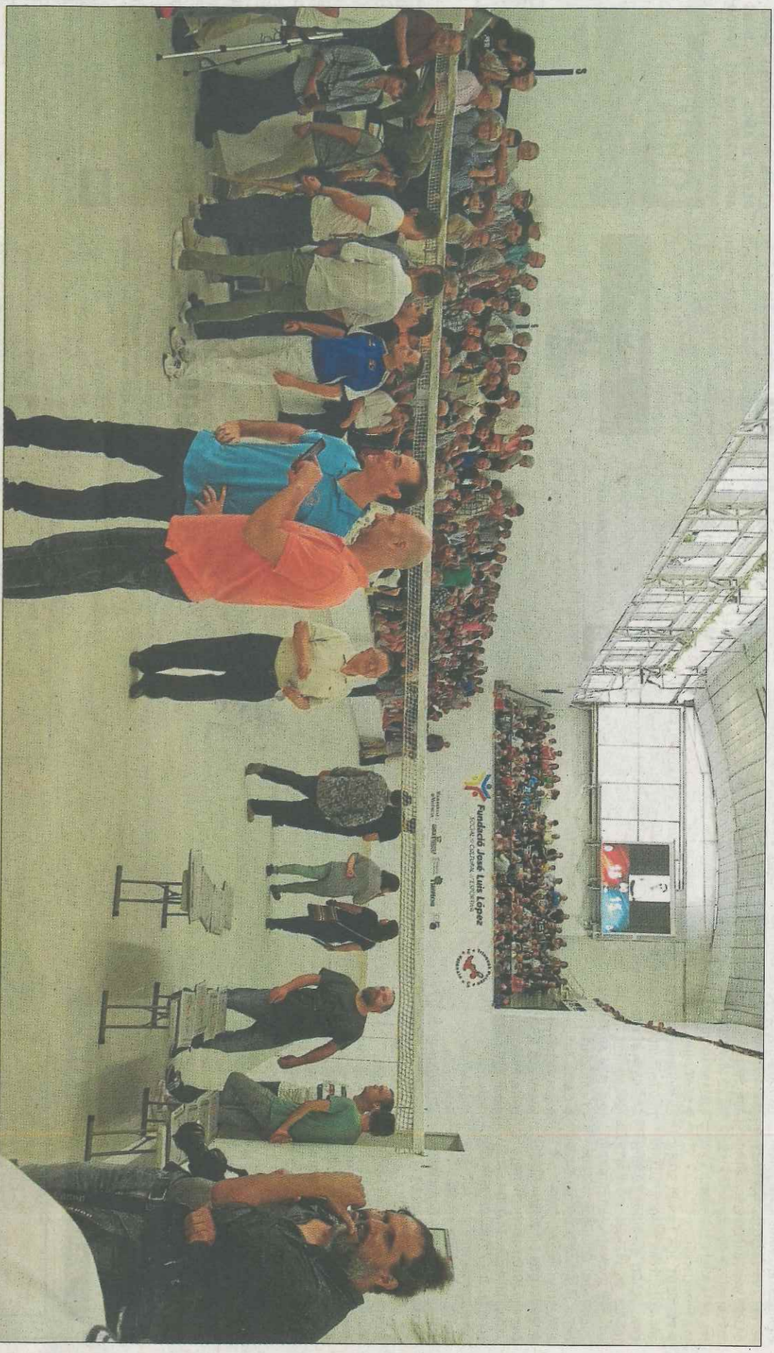
Les grades del trinquet de Pelayo es van omplir per a viure un dia històric per a la pilota valenciana.

CORREO ELECTRÓNICO levante.deportes@epi.es