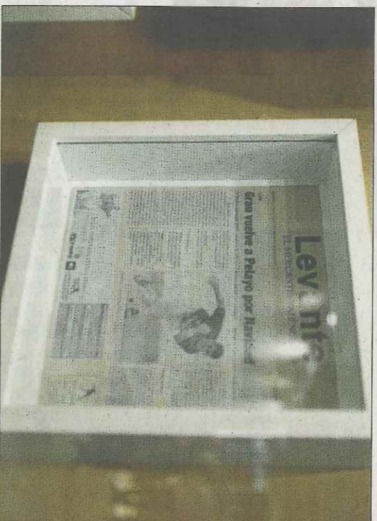
Una portada de Levante-EMV figura en el trinquet.

Trobes en la nova cafeteria una elegància que recupera les bigues de fusta de mobila en una sublim obra d'art rematada amb les mans i la pilota de valetes i tens la certesa que s'ha aconseguit una perfecta conjunció de la modernitat recolzada en la tradició. Tot un tractat de filosofia, del que supposem prendrien nota els més alts dignataris del poble valencià: Ximo Puig i Enric Morera. Vist allò que s'ha vist cal do-