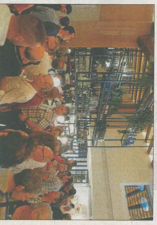
Les instal·lacions interiors són espectaculars. E. RIPPOLL

Agraïment a les mares de Puchol de Vinalesa, d'Héctor de la Vall de Laguar, de Genovés II,