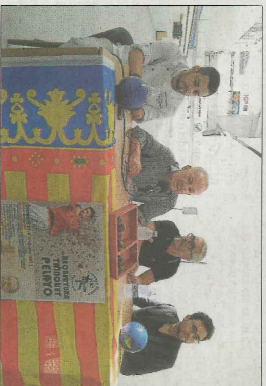
Presentació de la nova imatge del trinquet Pelayo. VN

D'esta manera, dos anys després, Pelayo, que el pròxim mes d'agost complirà 150 anys, llueix més jove que mai, però sempre respectant i mantenint l'essència dels seus orígens. Hui la seua nova imatge es presenta en societat. Esta vesprada comença una nova temporada i ho fa amb tots els honors, amb la tradicional partida professional d'escala i corda, però també amb par-