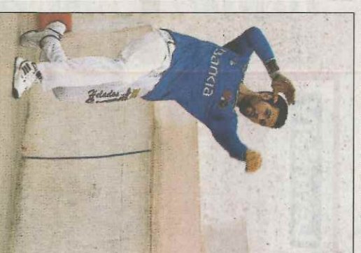
Pere Roc II juga hui a Pedreguer.