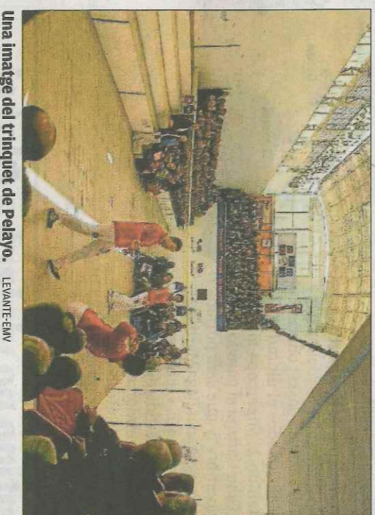
Una imatge del trinquet de Pelayo.

cedia amb lentitud per a extrair les aigües amb què es refrescaven aquell 20 d'agost de 1868, els músics de la banda que van acompanyar l'acte inaugural, les primeres autoritats, amb l'alcalde al front, i les primeres figures de l'època. Ens imaginem les camises arromangades, i els caliquenyos dels vells hortolans que, davant del reclam de la premsa i del boca a boca, van omplir les grades d'aquell recinte que s'anunciava com el millor dels destinats al joc de pilota en tota Espanya.