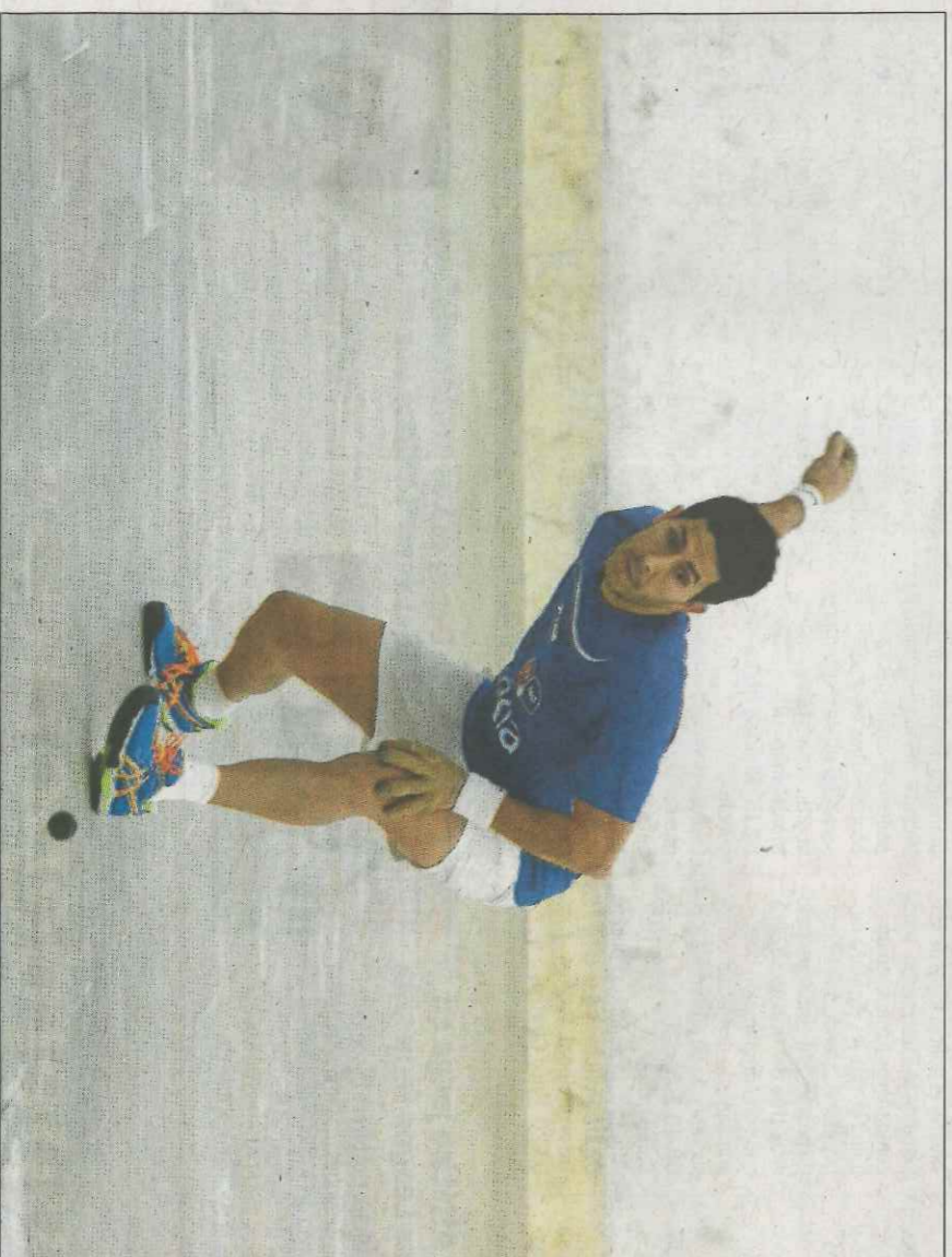
Miravalles s'ha classificat per als quarts de final de l'Individual de raspall. VAL NET

Els dos pilotaris tenen l'arma principal en la pegada. I en el físic. Pot ser una lluita de gladiadors. El supervivent accedirà a quarts de final on l'espera Marrahí.