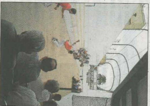
El Tío Pena' ahrir. VI

La partida va ser dauera. Els pri-mers a trencar des del rest van ser