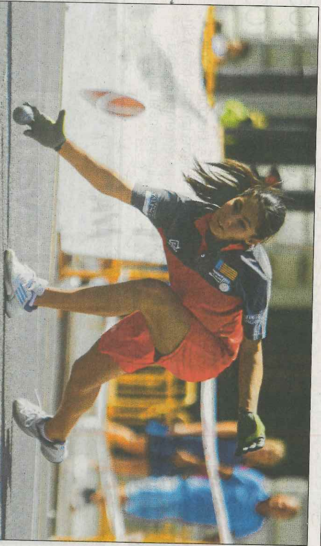
Les seleccions femenines sub-17 i sub-19 van protagonitzar una exhibició de joc internacional. EDUARDO RIPOLL

partida de llargues entre Benidorm i la selecció juvenil. Exhibicions i reconeixements A més de les escoles de pilota, els grans protagonistes ahir van ser els premiats per la Federació de Pilota