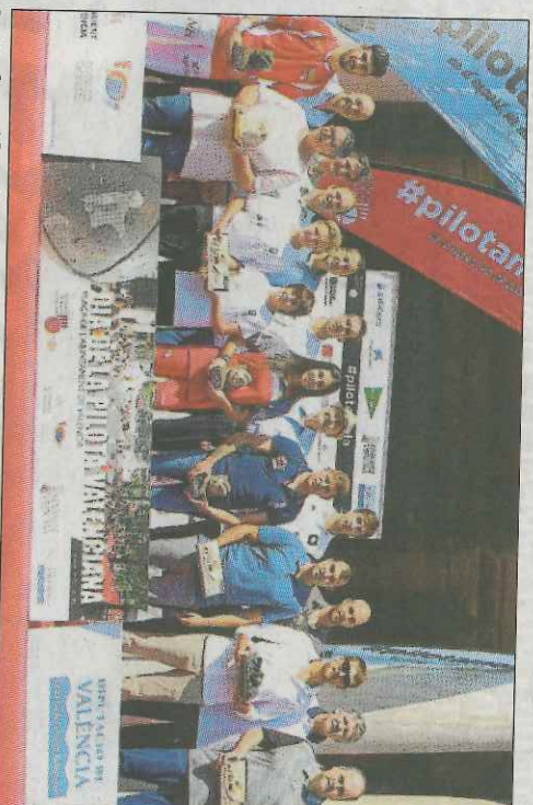
La Federació va lliurar els premis anuals. Genovés, un dels més buscats. Partida de raspall adaptat. E. RIPOLL