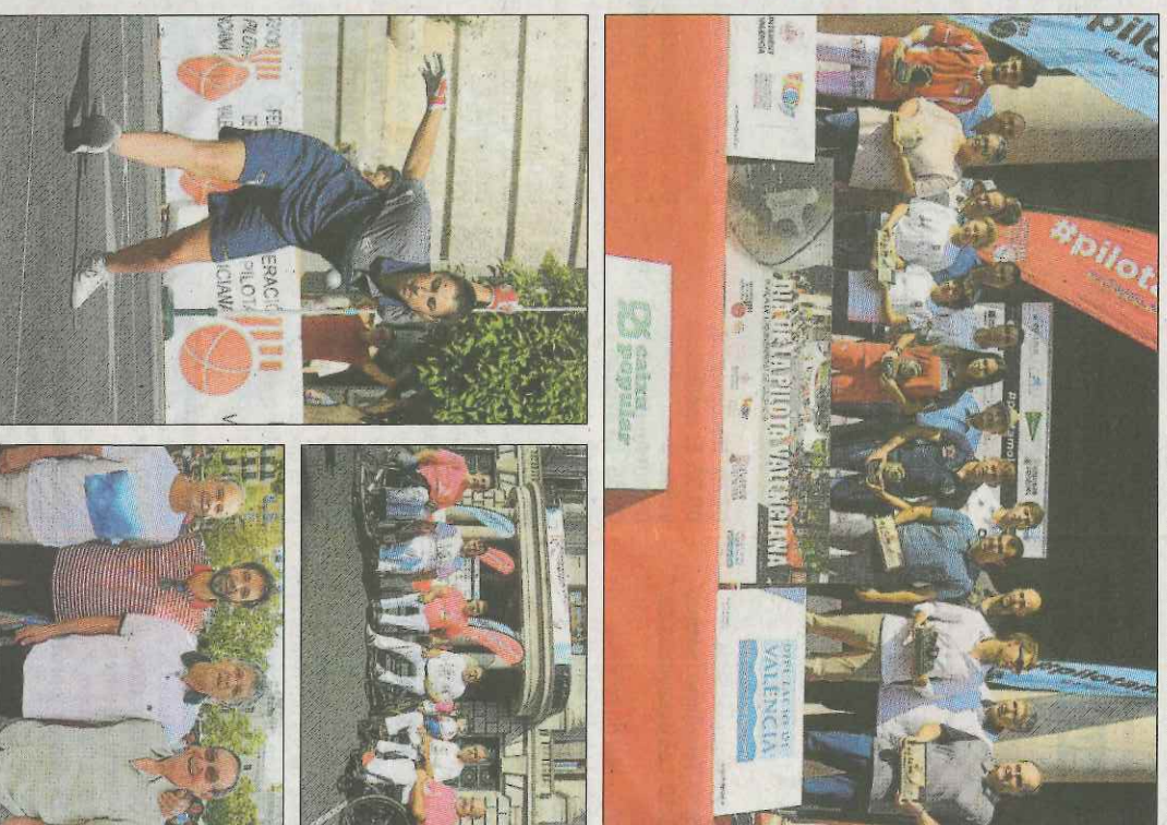
Grans, menuts, professionals i aficionats participaren ahir en el XXVI Dia de la Pilota en la Plaça de l'Ajuntament de València, tot un clàssic en la capital del Turia. VAL NET