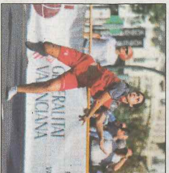
Partida femenina. EDUARDO RIPOLL

La fiesta de la pilota toma las calles del centro de València