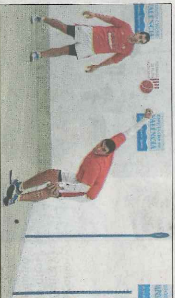
Els campions de Xeraco, en la final de 2016.