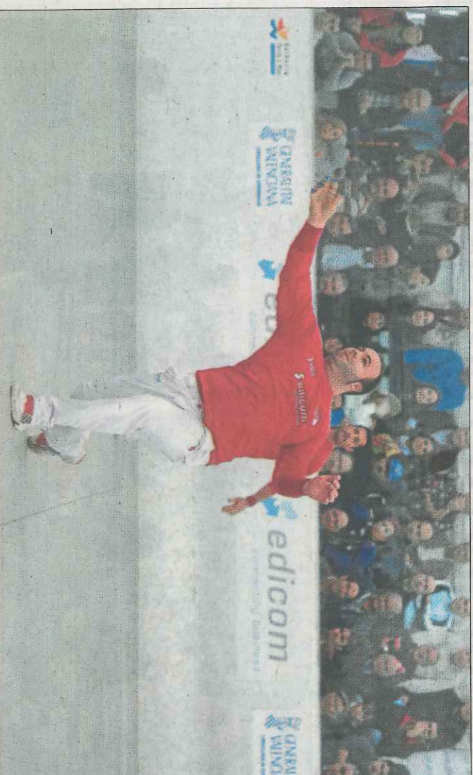
l'Electrofassar Massalfassar rebrà al CPV Borbotó en la que serà la partida de la jornada. FPV

► Massalfassar i Borbotó, empatats a punts, s'enfronten en la primera categoria de l'Interpobles de galotxa