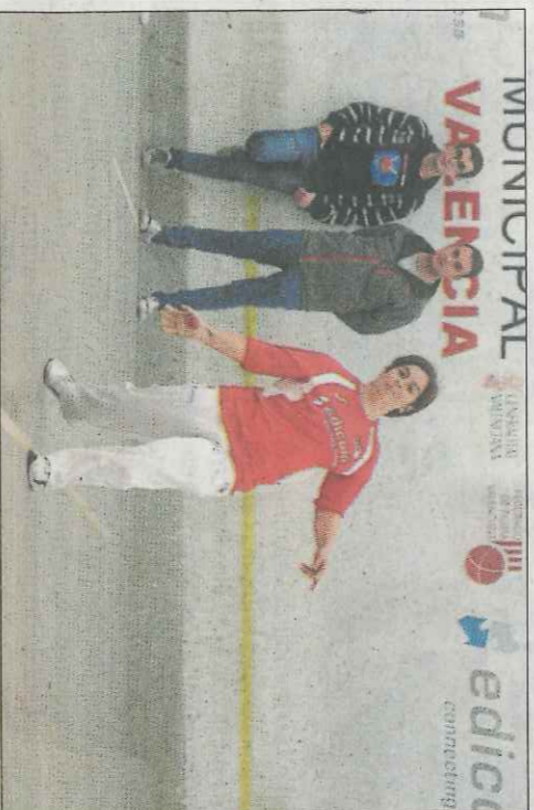
El CPV Borbotó juga per a reeditar el títol aconseguit en 2016.