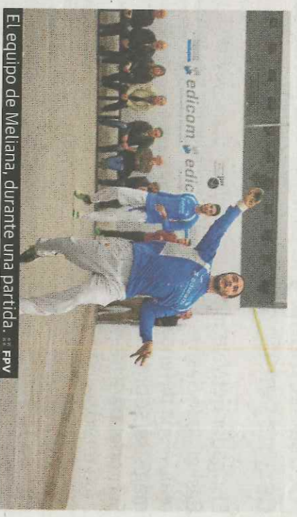
El equipo de Melana, durante una partida.

:: R. D. Montserrat, Massalfassar y Borbotó lideran la máxima categoría del XXXI Campeonato Interpobles de Galotxa, gran trofeo Edicom. En el grupo A, el Lanzadera Montserrat consiguió la victoria