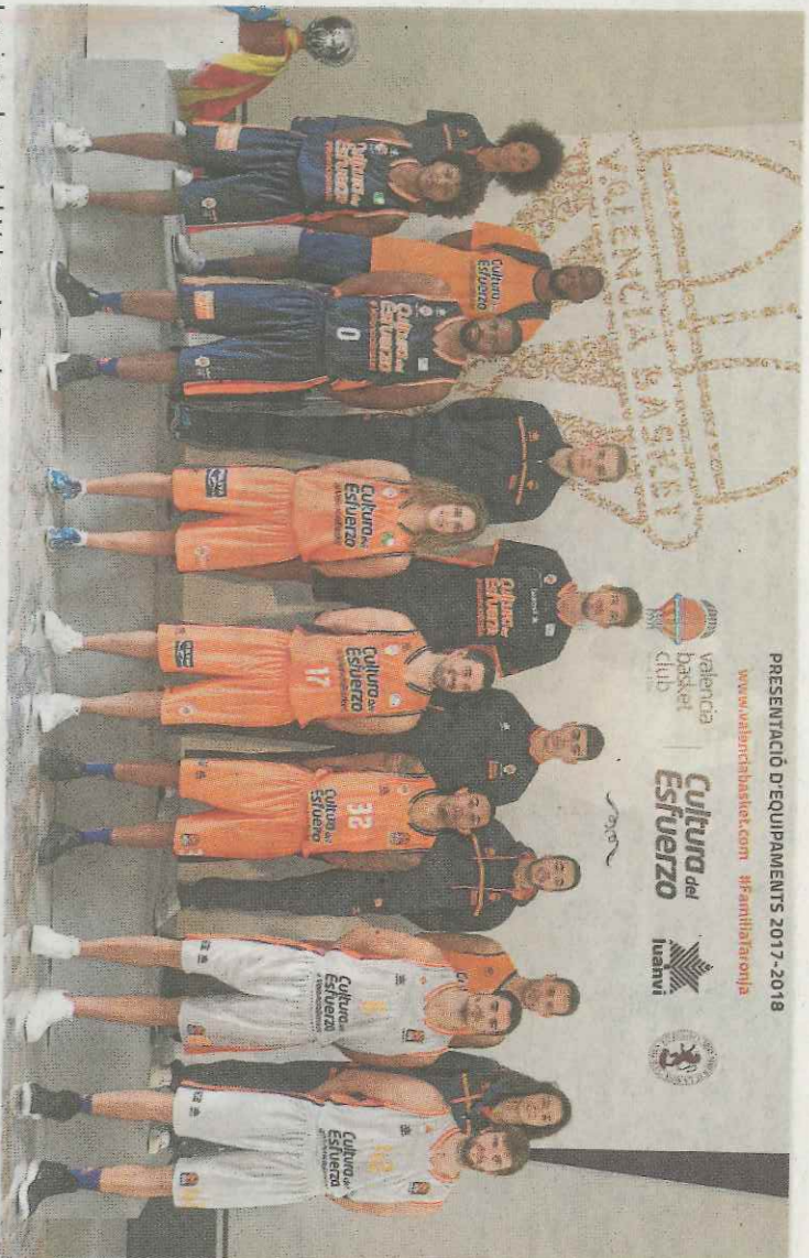
Los jugadores del Valencia Basket posan con las nuevas equipaciones.