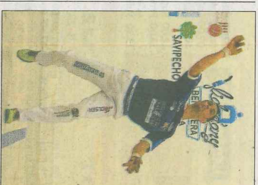
Pere de Pedreguer. VN