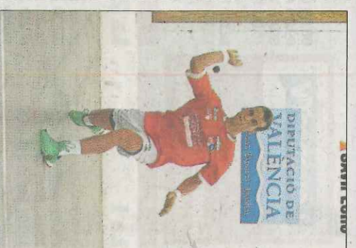
Moltó va guanyar dos sub '23.

Toca gaudir hui a Vinallesa amb frontó valencià. 25 metres de muralles de color verd que tremolaran amb el so de la pilota de tec.