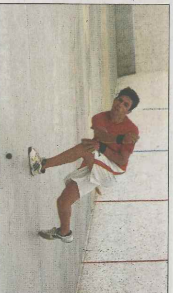
Seve, finalista individual del 2017. FPV

■ Rafaelburyol viurà de nou raspall de primera en el Campionat Autonòmic de Raspall Parelles. Aquest cap de setmana el trinquet de l'Horta Nord acollirà la partida entre el Rafaelburyol A, on juguen Escoto i Moro, i el nou equip de Belleguard, Xeraco, vigent campió, jugarà com a local al seu trinquet contra La Vall. La partida entre Lloc Nou de Renollet i Bicoorp completarà la jornada. En primera femenina les partides seran entre Beniparrell i Txernes i Manques, Alqueria d'Asnar i Bicoorp, i el derbi entre Borbotó A i B.