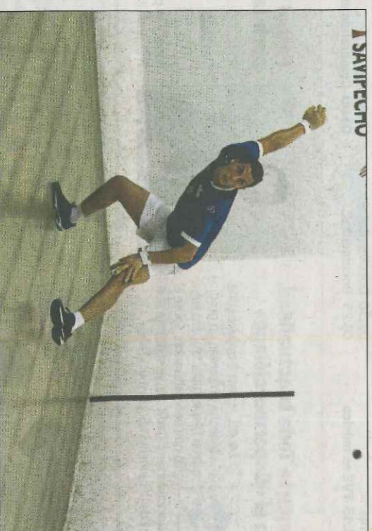
Ian juga esta vesprada la segona semifinal del trofeu Mancomunitat.