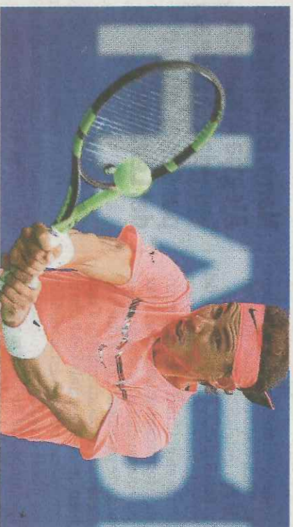
Rafa Nadal, ayer en Nueva York.