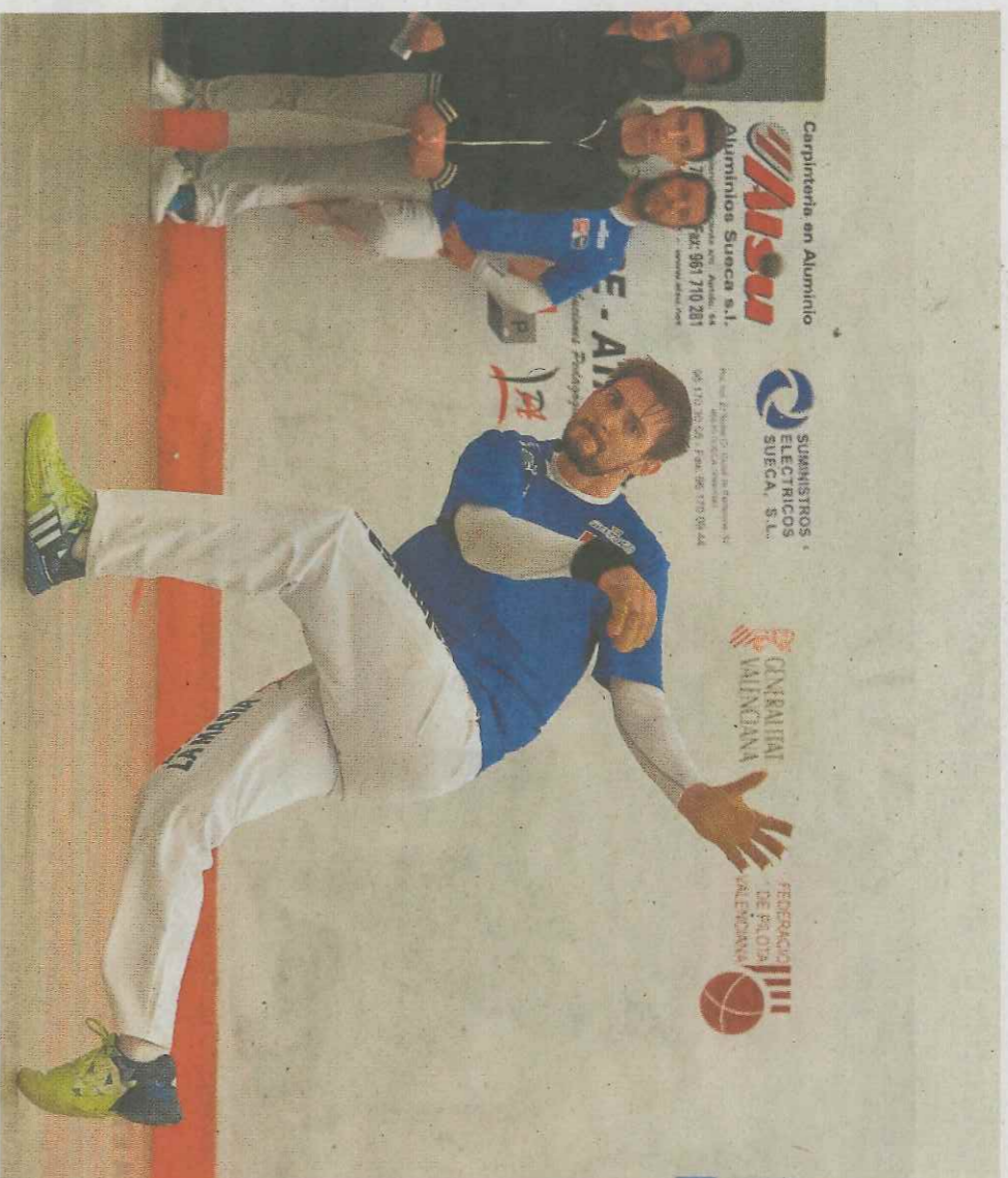
Soro III, durante una partida.

VALENCIA. El Campionat Individual en la modalidad de escala i corda ya está en horno. El de Raspall, a punto de entrar, pero se cocinará un poco más tarde. Federació, Val Net y trinqueters se reunieron ayer para ultimar la próxima edición de la competición per dalt corda. El inicio, las fases previas, comenzarán en menos de quince días. En el trinquet hay expectación porque este año estarán todos los que deben estar, los especia-