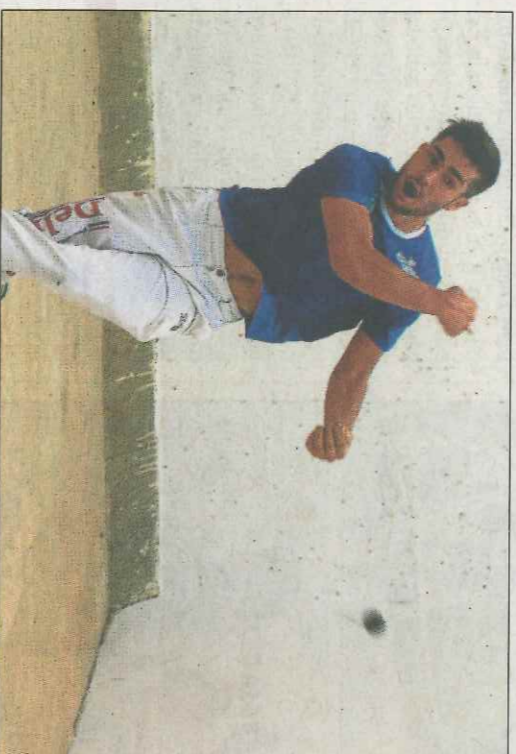
Francés va fer una gran final i va tindre la victòria a dos 'vals'. SO