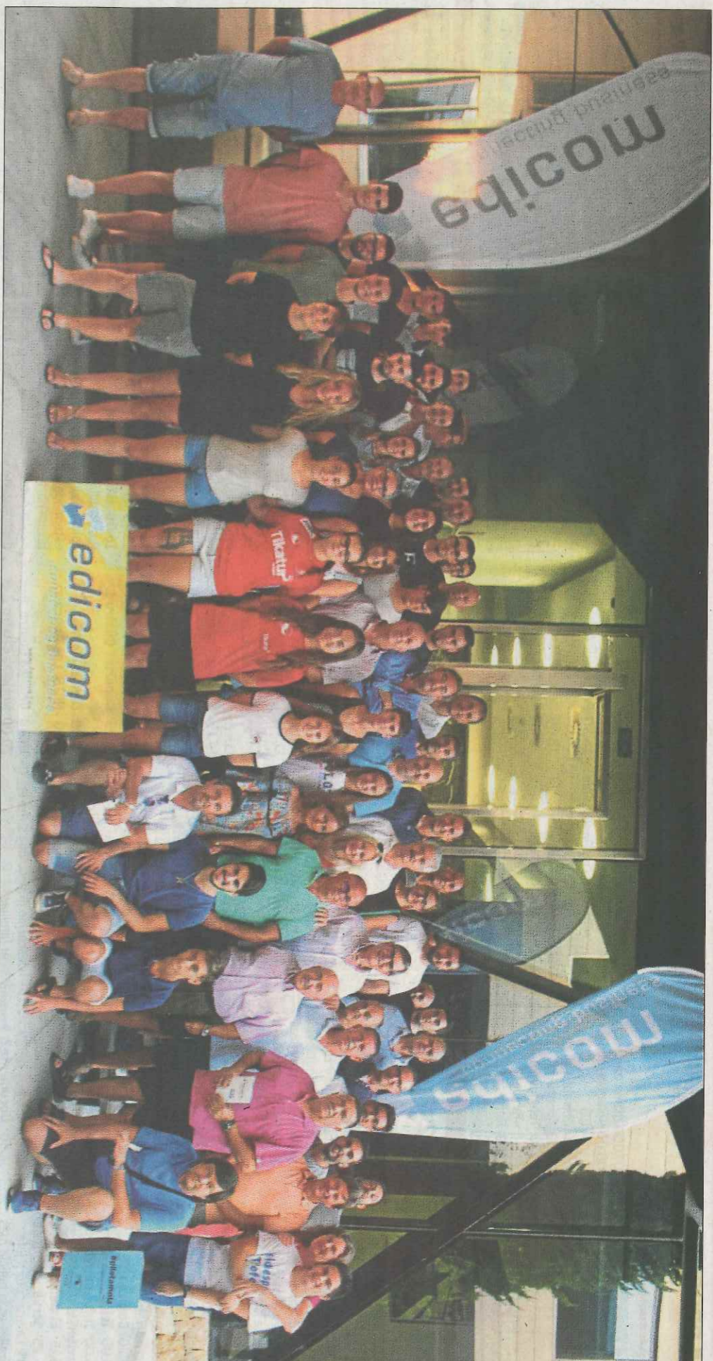
Edicom va acollir als clubs de galotxa en la seu principal d'aquesta empresa internacional. SP