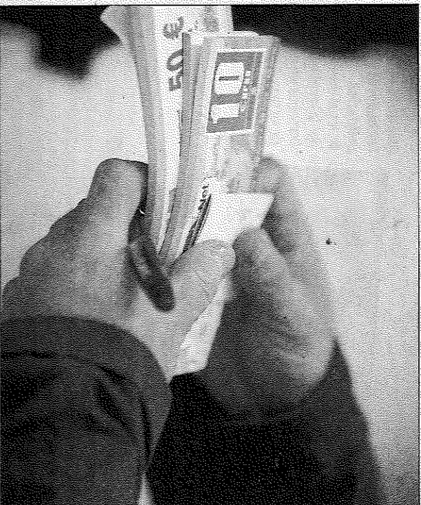
Talonari de traveses, en una partida al trinquet de Pelayo. C. CABALLERO

El dia que no era possible arrendar les apostes, és a dir, que els postors més forts no entraven a jugar-se els diners, els pilots reseraven forces perquè l'endemà, en qualsevol trinquet, tindrien l'oportunitat de millorar els ingressos. El dia que no quadrava la travesa, el jugador cobraria un jornal del que es teia de les entrades venudes. Poca cosa.