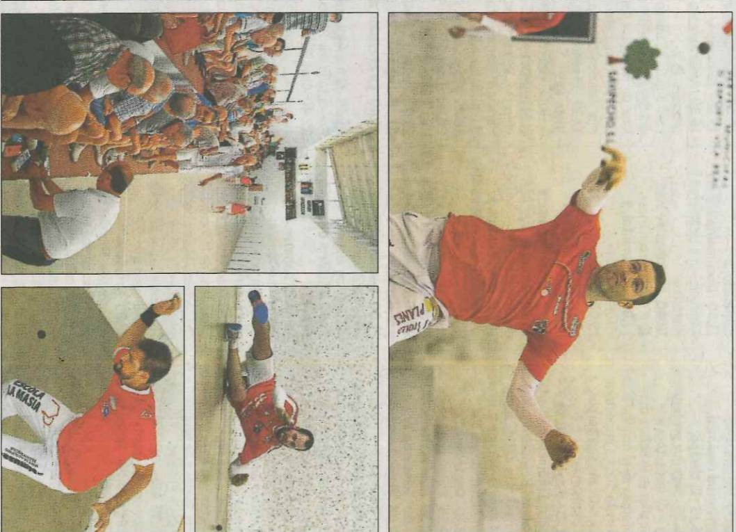
Dimarts a Massamagrell és la final del 'Tio Pena', dimecres a Castelló de Rugat la final del 'Agrupost' i divendres a Vila-real comença el trofeu. A Alfarp va guanyar l'equip de Soro. VN