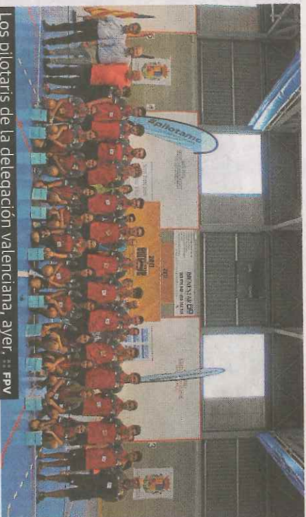
Los pilotaris de la delegación valenciana, ayer.

PELOTA :: R. D. El Eurojove, el campeonato que congrega a las promesas de la pelota a mano de toda Europa, ya está en marcha. La inauguración tuvo lugar ayer en Tavernes Blanques, donde se celebra un torneo en el que participan más de 100 chicos y chicas de todo el continente. La delegación valenciana jugó ayer nueve partidas.