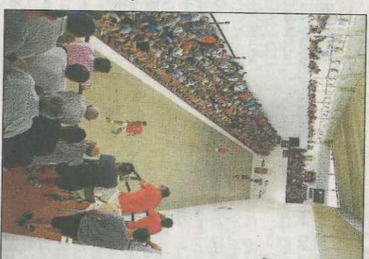
Trinquet de Castelló de Rugat. VN

La final serà dimecres 2 d'agost també al trinquet de la localitat de Castelló de Rugat. Cadascuna de les dues semifinals tindrà un premi de 250 euros i la final 600 euros. Abans de les partides professionals també