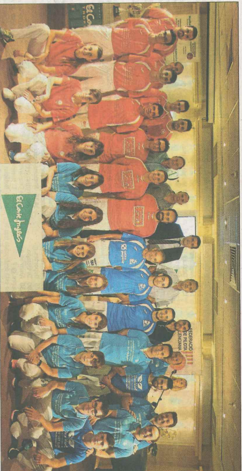
La gran final de primera tindrà a Kiwa Quart i Inmob. Palanca Fois com a protagonistes.