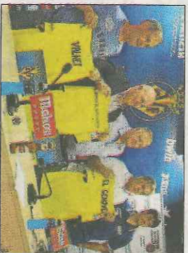
Moment de la presentació.