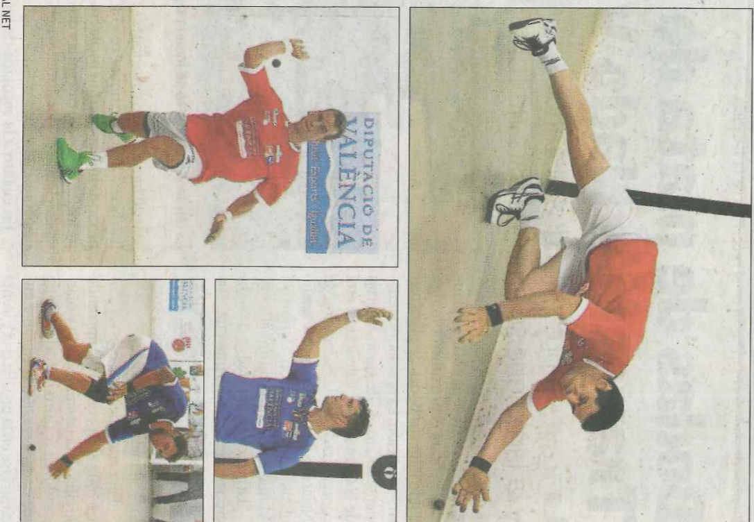
Diferents instants de la final de la Copa Diputació de València de raspall, ahir al trinquet de Castelló de Rugat.