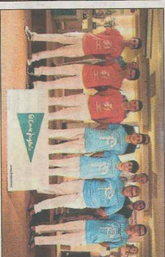
La primera final femenina de la competició la disputaran Borbotó i Godolleta. SD