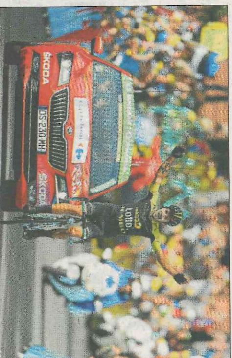
Roglić se impulsó al esprint.

► El ciclista esloveno conquista la mítica cima y Chris Froome mantiene el maillot amarillo