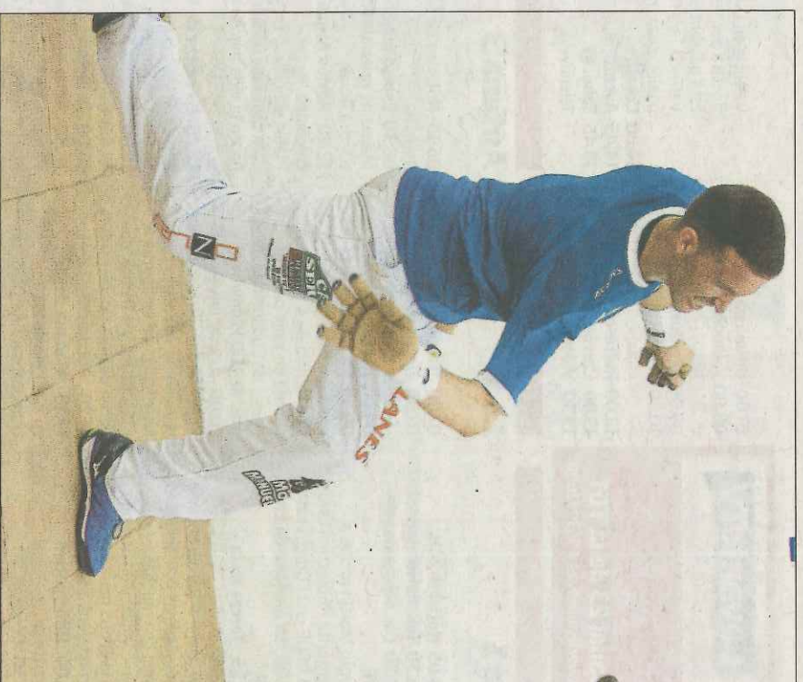
Salva va completar una gran partida ahir a Massamagrell. J.R.