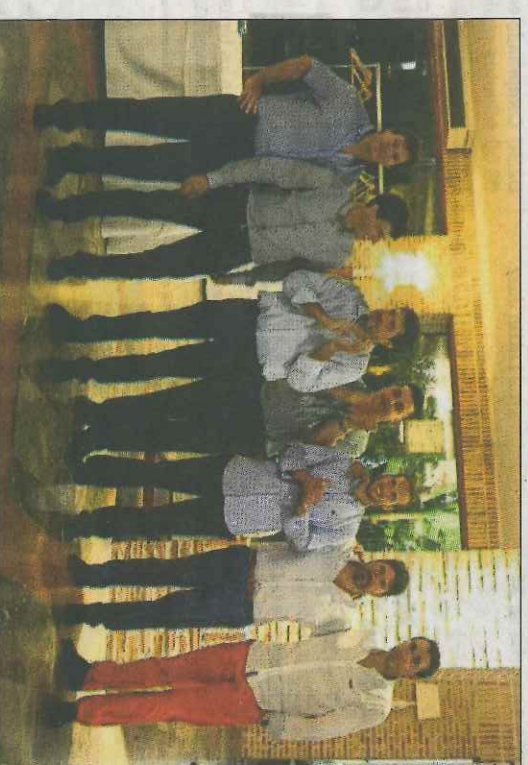
Membres de l'actual directiva de El Puig. OS

ri molt d'orgull d'una pedrera que és el motor de futur d'un club modelic.