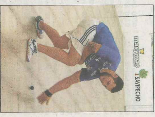
Sanchis de Montesa. ▼

En les línies capdavanteres estan els mitgers que volen proclamar-se hereus de la corona de Coe-