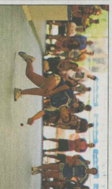
Victoria podria jugar la final que es disputarà a Borbotó. FPV

■ El 22 i 23 de juliol arrancarà la 28 lliga de Perxa-Trofeu Diputació d'Alacantí. La lliga es presentava el passat diumenge al carrer la Lluna de Pedreguer aprofitant les finals de les lligues de palma i llargues. La competició s'allargarà fins novembre i compta amb novetats com la inclusió d'un grup de la província de València per primera volta en la història. Sella serà el club que més equips presente amb un total de quatre, a més comptarà amb dos d'ells a la màxima categoria.