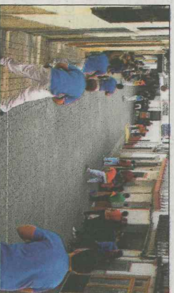
Final de perxa a Castell de Castells el 2016.