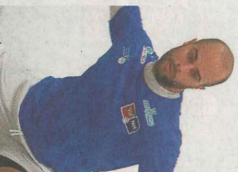
Brisca, en acción.

Los vencedores de esta tarde esperarán a mañana para conocer a su rival. La otra semifinal se disputará por la tarde en el trinquet de Belleguard. Si hoy en Piles se medirán los mitgers finalistas de la Liga, mañana será el turno de los res-