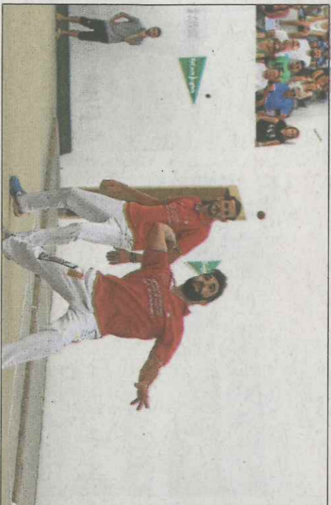
Si Faura vol jugar la final, haurà a guanyar a domicili a Foios. FPV