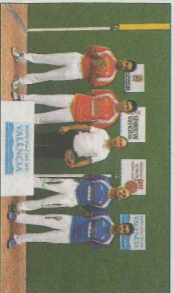
Els protagonistes de la final del Diputació de Frontó. FPV