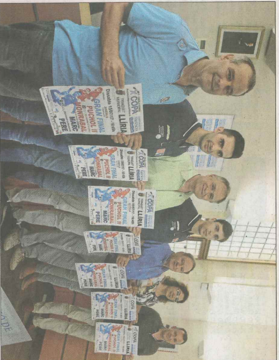
Pilotaris i autoritats en un moment de la presentació d'ahir en l'Ajuntament de Llíria. VAL NET

ter II. Semblava que el regnat anava a ser per a Sanchis i la seua esquerra, que és un martell. El de Montesa és un espectacle dins del trinquet, habitual de les finals i campió de tot. Però és que Brisca ha emergit per a qüestionar el seu domini. Ara són igual de letals. Va per dies. Qui estiga hui més encertat tindrà la recompensa de la gran final.