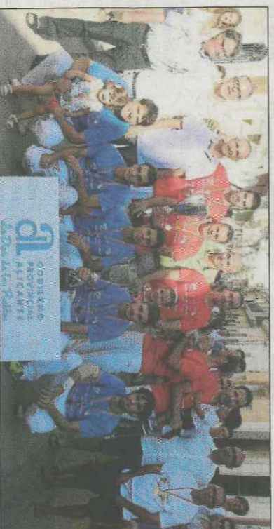
Agost i Murla, finalistes de la Lliga de Palma.