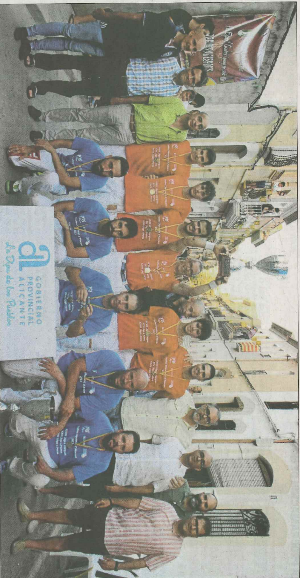
Els equips de Benidorm i Campello, protagonistes de la final de Llargues. SD