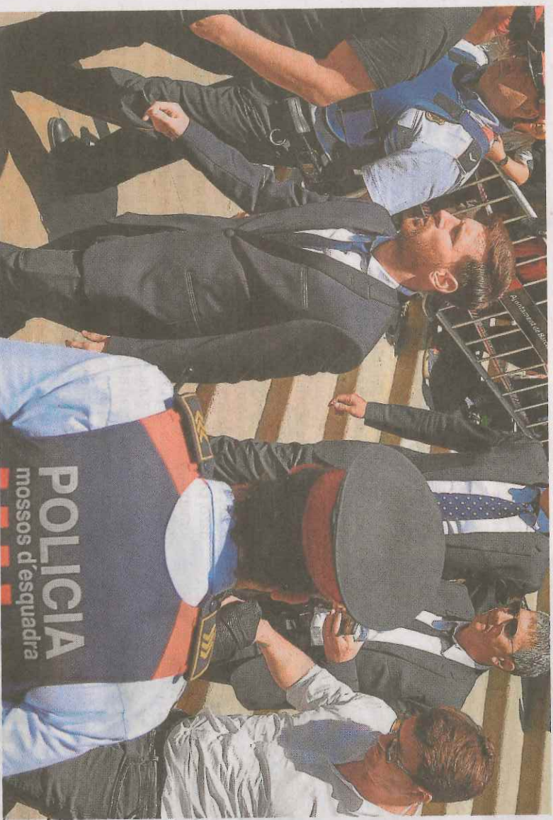
Messi sale del juzgado tras declarar en junio de 2016.