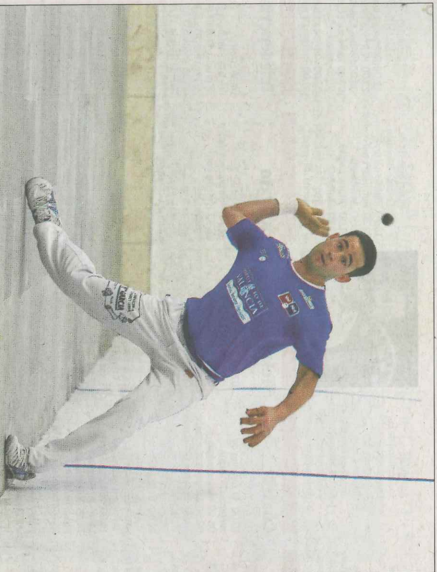
Pere Roc II i Jesús s'enfronten a Marc i Pere per un lloc a la gran final de Copa. VN