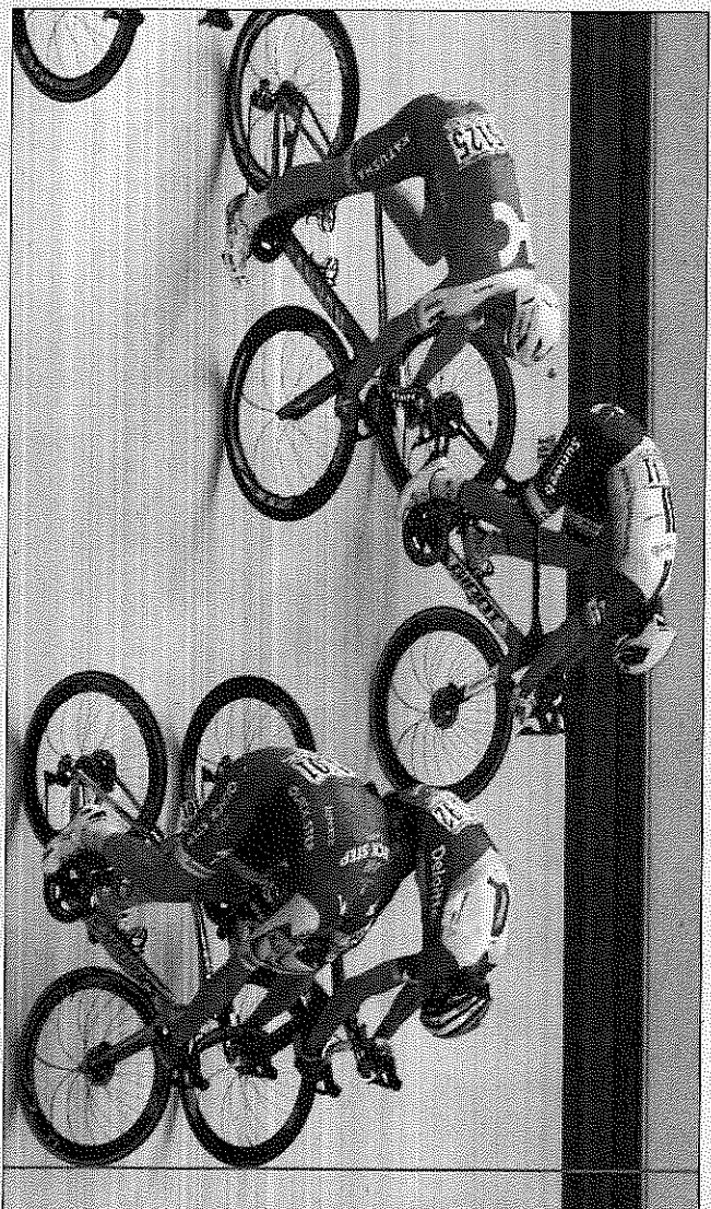
El esprinter igualó el récord de su llustre compatriota Erik Zabel.