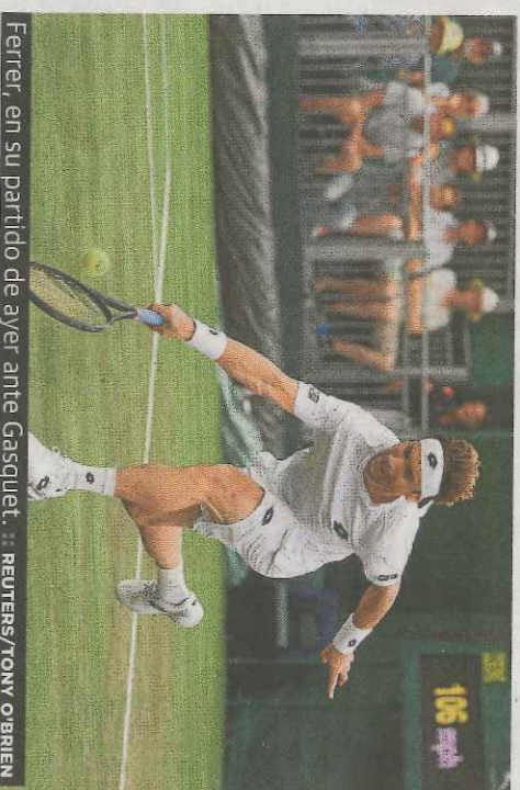
Ferrer, en su partido de ayer ante Gasquet.