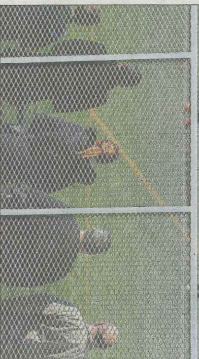
Padres de jugadores ven un partido de fútbol base en Valencia.

Y de su área metropolitana, es que los padres llevan a sus hijos/as a las famosas «pruebas», alardeando de las hazañas conseguidas en sus equipos, palabra ésta última - «equipo»- que queda en el olvido por completo, intentando despertar cierto interés por parte de otros clubes y, sobre todo, dando a conocer al chaval a la chavala. No son pocos los padres que a día de hoy llevan a los clubes vídeos de las mejores ju-