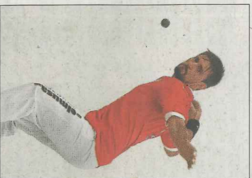
Soro III en la Copa. VN

Després de la igualada a 35 van arribar els millors moments. La