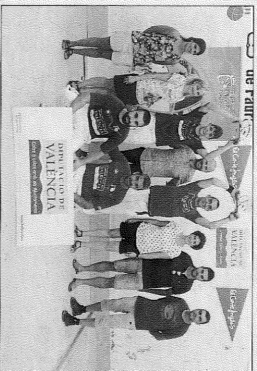
Guanyadors i finalistes, ahir a Faura.