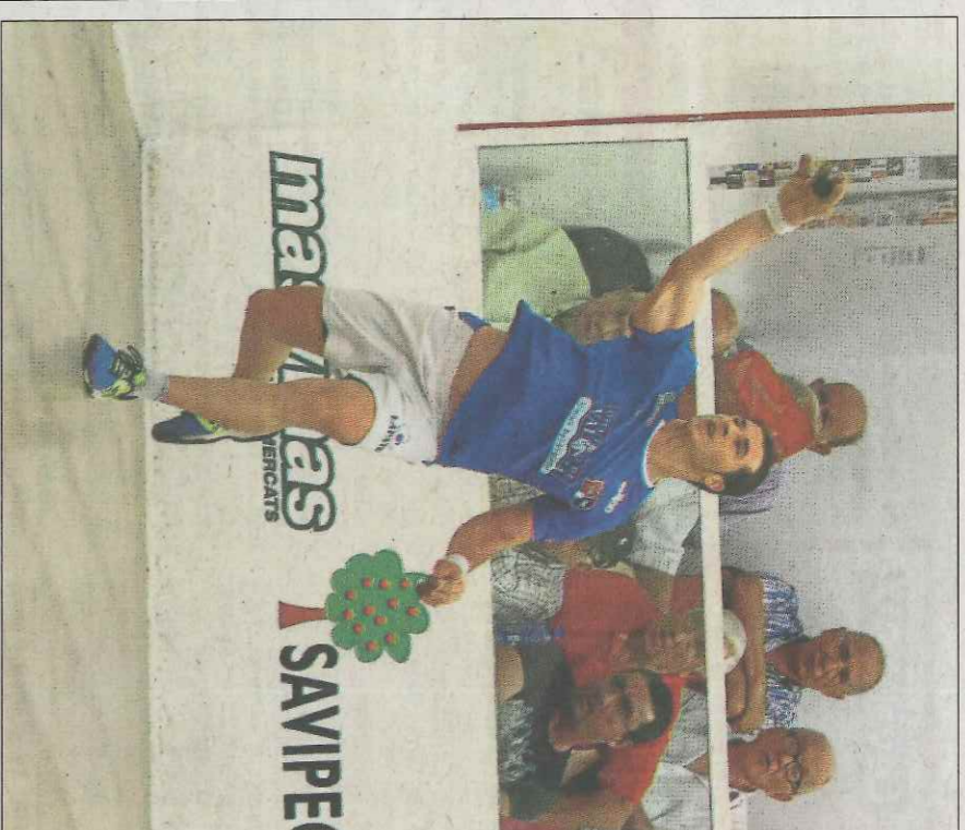
Moncho i el seu company Coeter II afronten hui una 'final'.