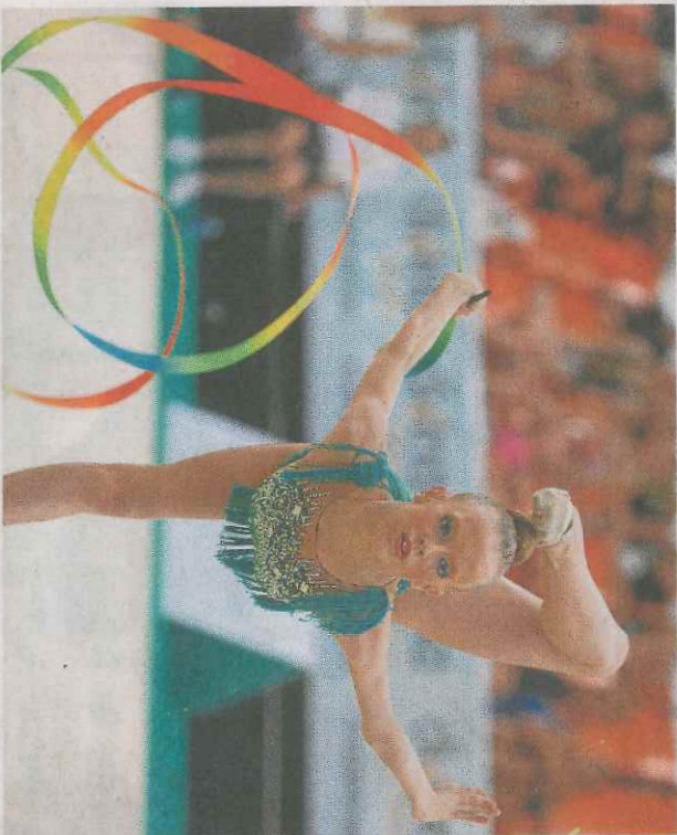
Una gimnasta realiza ayer un ejercicio de cinta.