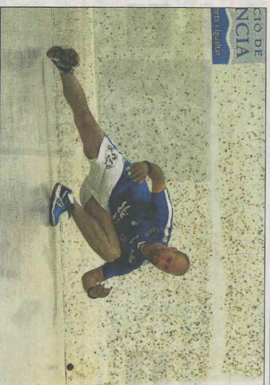
Ricard no es va trobar l'oposició esperada en la seua estrena. VN

La següent partida, corresponent al Grup B, es jugarà el divendres a Piles on Ian i Josep jugaran contra Pablo i Canari.