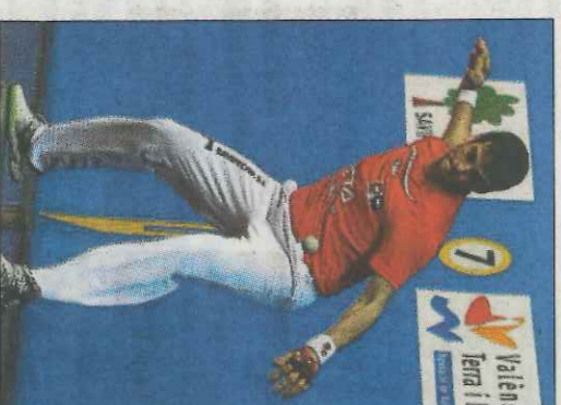
Genovés II en El Puig. WN

Natural de Letza, Navarra, i establert a Pamplona, Barriola ha guanyat totes les competicions més rellevants de la pilota del nord, això