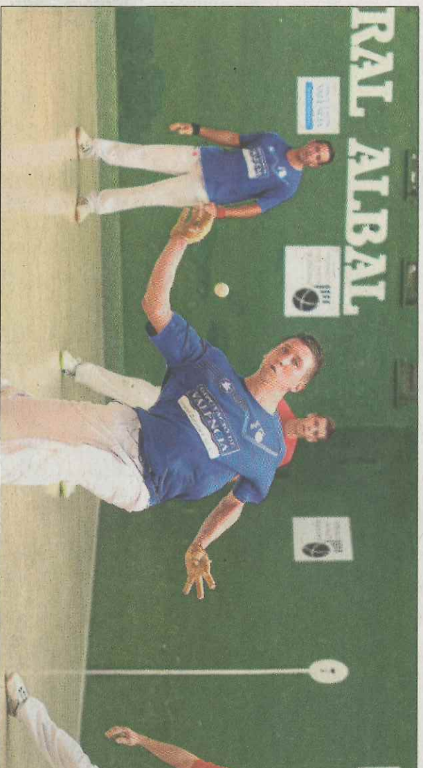
Moro i Pasqual, de la Pobla, actuals campions de la competició.

En la segona categoria estan disputant-se els quarts de final. No obstant, per diferents motius, ja hi ha dos equips que han accedit de manera directa a les semi-