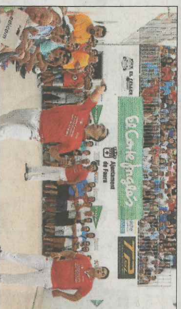
Faura tornarà a viure l'espectacle d'unes finals oficials. FPV

■ Les finals del 42é Campionat Autonòmic de Galotxa, gran trofeu El Corte Inglés, corresponents a les categories de competició de trinquet i escoles, viuran la seua presentació el dimarts 21 de juny, a les 20 hores, en la 8.ª planta de l'edifici d'El Corte Inglés de l'avinguda de França. Estan convocats els equips finalistes de les quatre finals de trinquet, que es jugaran en Torrent el primer cap de setmana de juliol, així com els huit equips de xiquets que jugaran les seues finals en Vinalesa el diumenge 25 de juny.