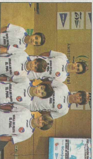
L'escola de El Puig jugarà tres de les quatre finals escolars. FPV

■ Mentre Bicorp Aixaraco A apunten a la final absoluta després de guanyar les primeres partides jugades davant Villalonga i Oliva, el carrer de Polinyà del Xiquet comença a preparar-se per acollir les finals que tindran lloc en la població de la Ribera el primer cap de setmana de juliol. Les finals programades per a la vesprada del dissabte 1 de juliol, la de primera masculina i la corresponent a primera femenina, la qual intentaràn jugar les xiques de Bicorp, Borbotó, Beniparrell i Moixent.