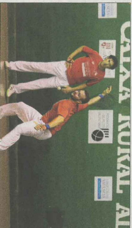
Beniparrell, clàssic en les categories d'entre setmana. FPV

finals, com són el Moixent A i l'Almussafes B, que esperen als seus rivals. Arribaran des de quarts de final i, donat els resultats de l'anada, tenen quasi totes les possibilitats els equips d'Algimnia i Pobla