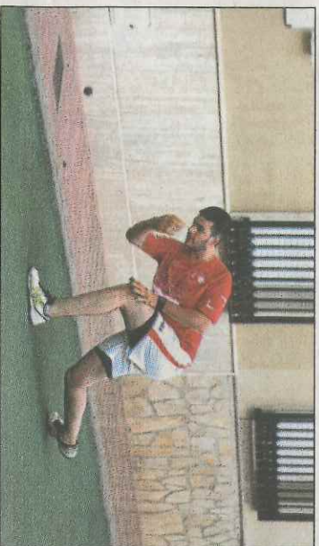
Vallllonga haurà de remuntar davant Bicorp en semis. FPV

En segona de palma passen les formacions de Calp, Sella i Tibi, a més de Benasau (millor segon). Calp i Sella protagonitzaran una semifinal i Benasau i Tibi l'altra. L'acta de llargues coneix tres semifinals: Agost, Crevellant i Xaló. Previsament Crevellant i Xaló ja disputaven entre setmana l'anada d'aquesta eliminatòria amb resultat de 8 a 10 per als de Xaló. El quart semifinalista eixirà de la prèvia entre el Nàquera A i Fondó de les Neus, de moment favorable als alacantins. Poble Nou-Sant Vicent i Sella-Agost seran les semifinals de la tercera categoria de palma. En juvenils, Sella contra Parcent i Orba contra Benidorm són les semifinals.