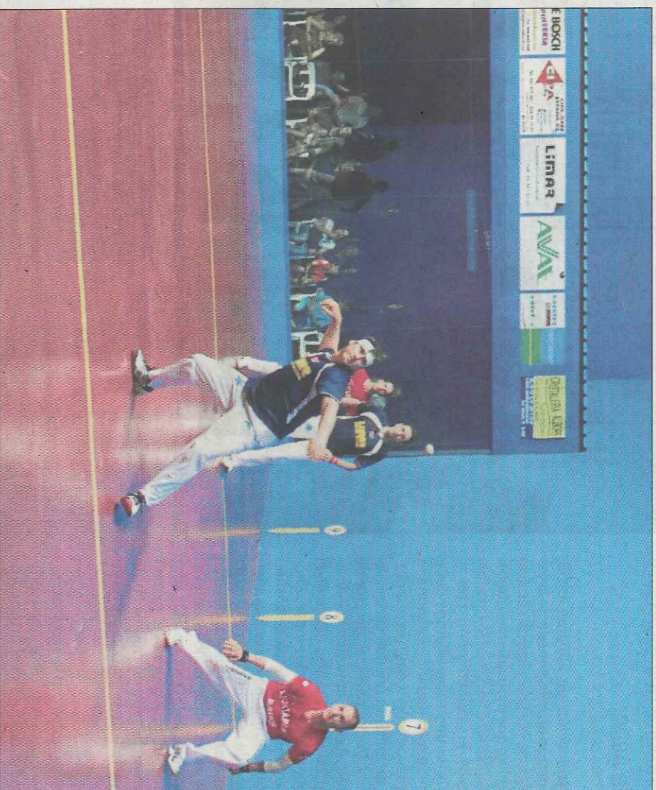
Una partida de frontó a les instal·lacions del Puig.