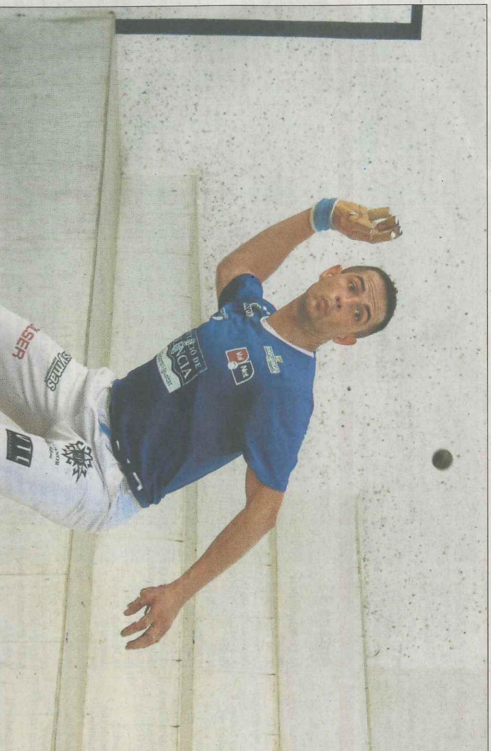
Les rematades de Pere, fortes i ben dirigides, van ser un autèntic maldecap per a Genovés II i Salva. VAL·NET