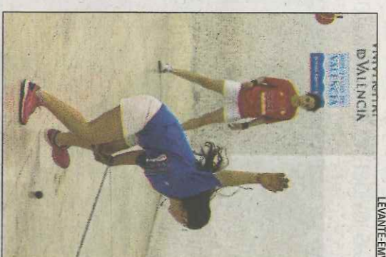
Una partida de raspall femení.