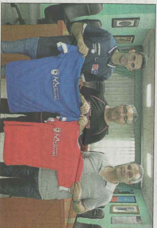
Moment de la presentació en l'Ajuntament de Montserrat.

Eixe va ser el punt d'inflexió en la trajectòria de Marc. A partir d'ací ha sigut un no parar. Vencedor d'uns quants trofeus de prestigi, se-