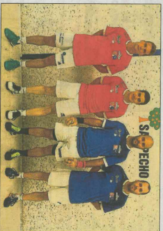
Els quatre protagonistes de la partida de raspall a Oliva.

En taquilla del trinquet, el mateix dissabte, el preu per a veure el mà a mà serà de 12 euros.