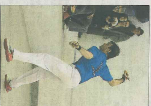
Genovés II. VAL NET

El pròxim dissabte, al trinquet de Bellreguard, s'annuncia el duel de ti-