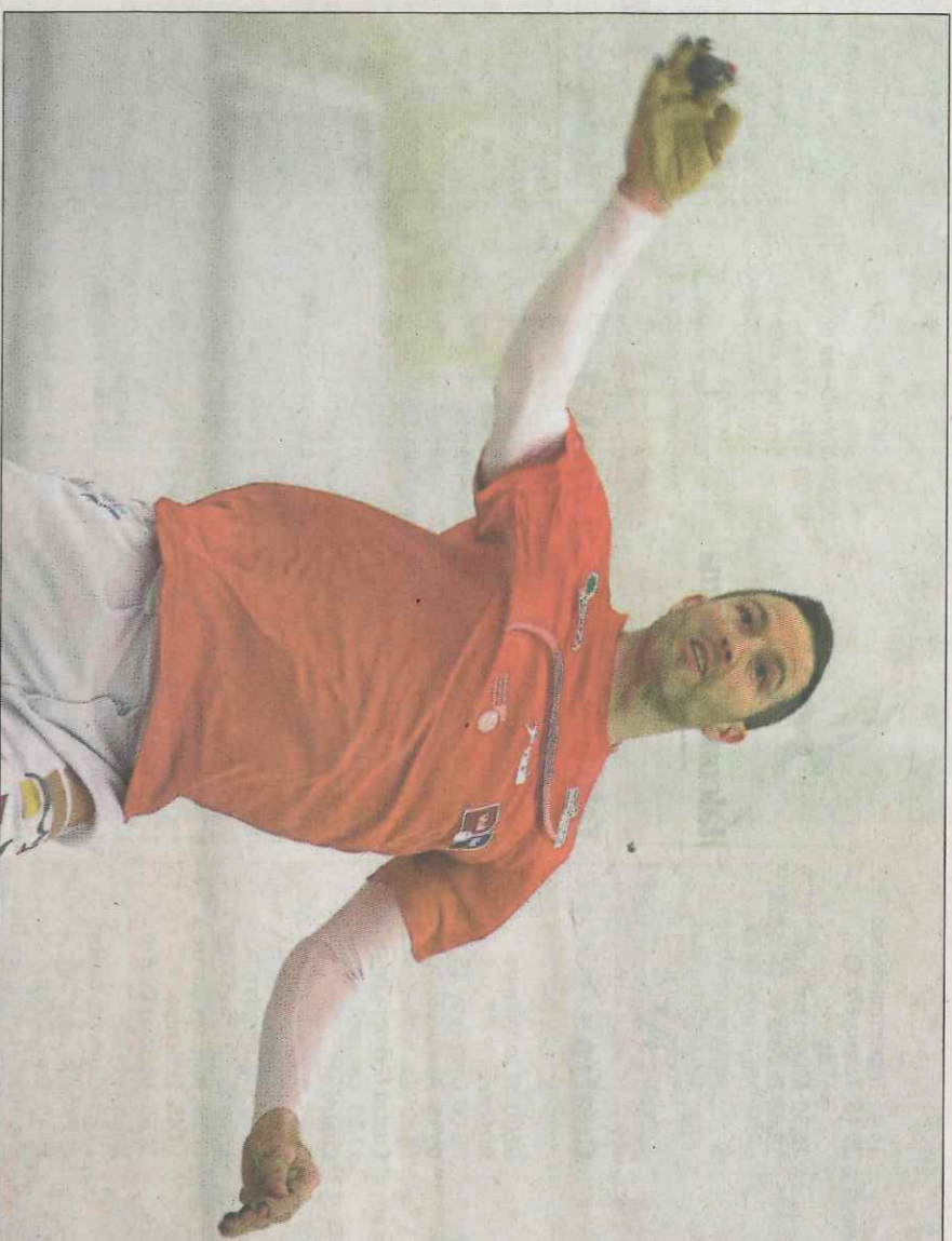
Salva jugarà diumenge al trinquet de Xàbia.