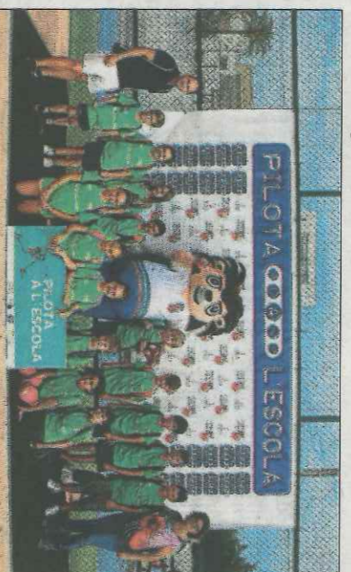
CRA Ribera Baixa-Llaurí. SD