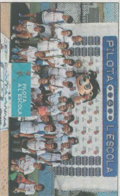
CEIP Santa Anna-Oliva. SD