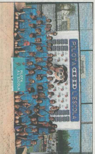
Col·legi La Encarnación-Sueca. SD