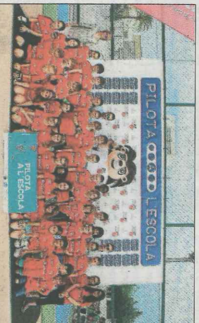
CEIP Luis Vives-Oliva. SD