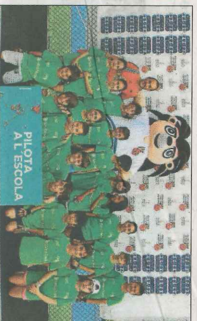
CEIP Benicadim-Beniarbeig. SD