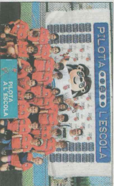
CEIP José Pedrós-Piles. SD