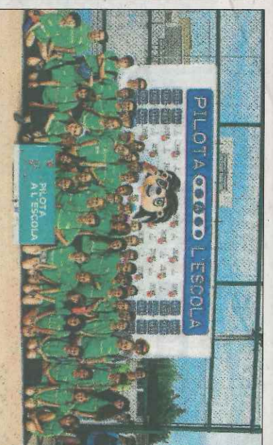
CEIP Hort de Palau-Oliva. SD