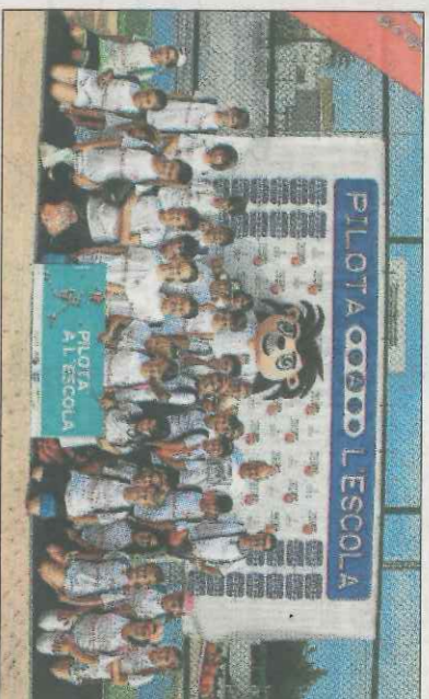
CEIP L'Alcoera-Polinyà. SD