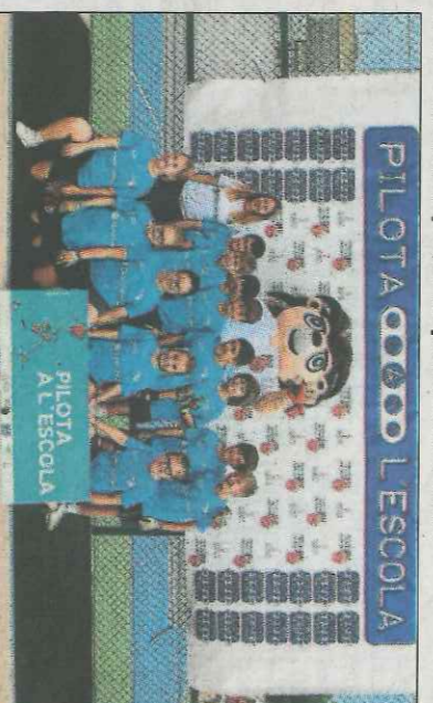
CP Los Narajos-Gandia. SD