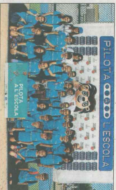
CEIP Alfadali-Oliva. SD