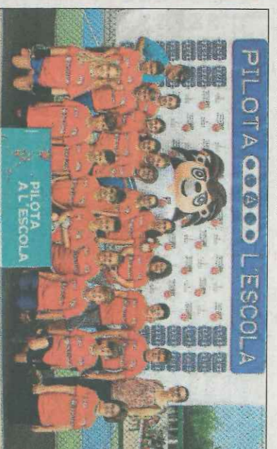
CEIP Sant Pere Apostol-Alqueria Contessa. SD