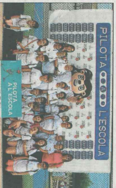
CEIP La Carrasca-Oliva. SD