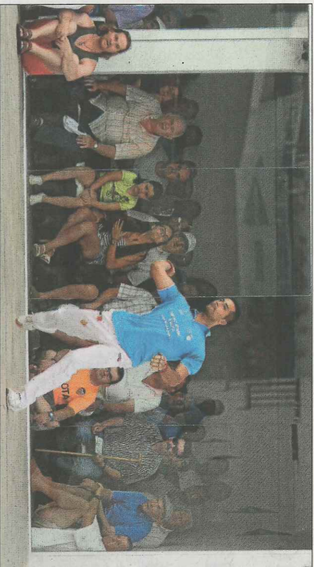
El Kiwa Quart de les Valls, ja a les semifinals, tornarà a lluitar pel títol absolut de El Corte Inglés. FPV