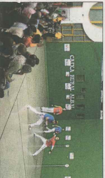
El Frontó d'Albal acollirà una decisiva partida.

La competició femenina viurà el que pot ser la final avançada, ja que les formacions capdavanteres de Borbotó, primeres en solitari amb 26 punts, i Godelleja, segones amb 22, s'enfrontaran aquesta jornada en el carrer de la pedania de València.