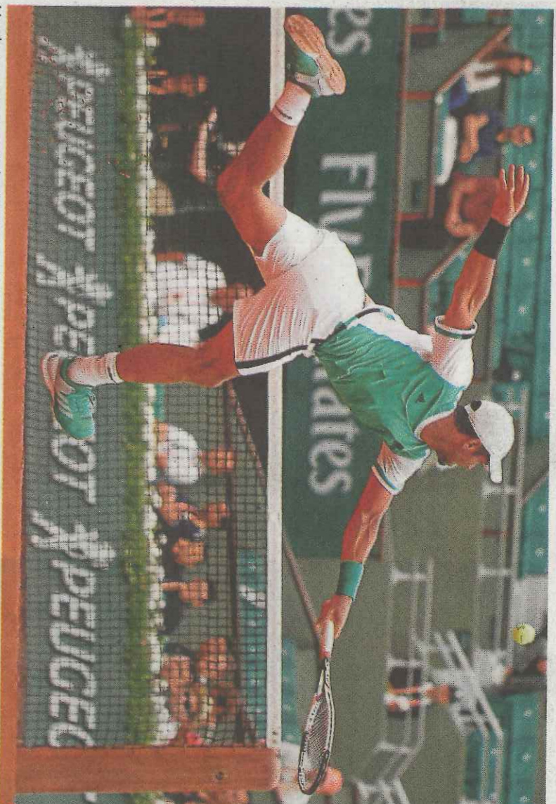
Verdasco, en su partido de ayer en Roland Garros.