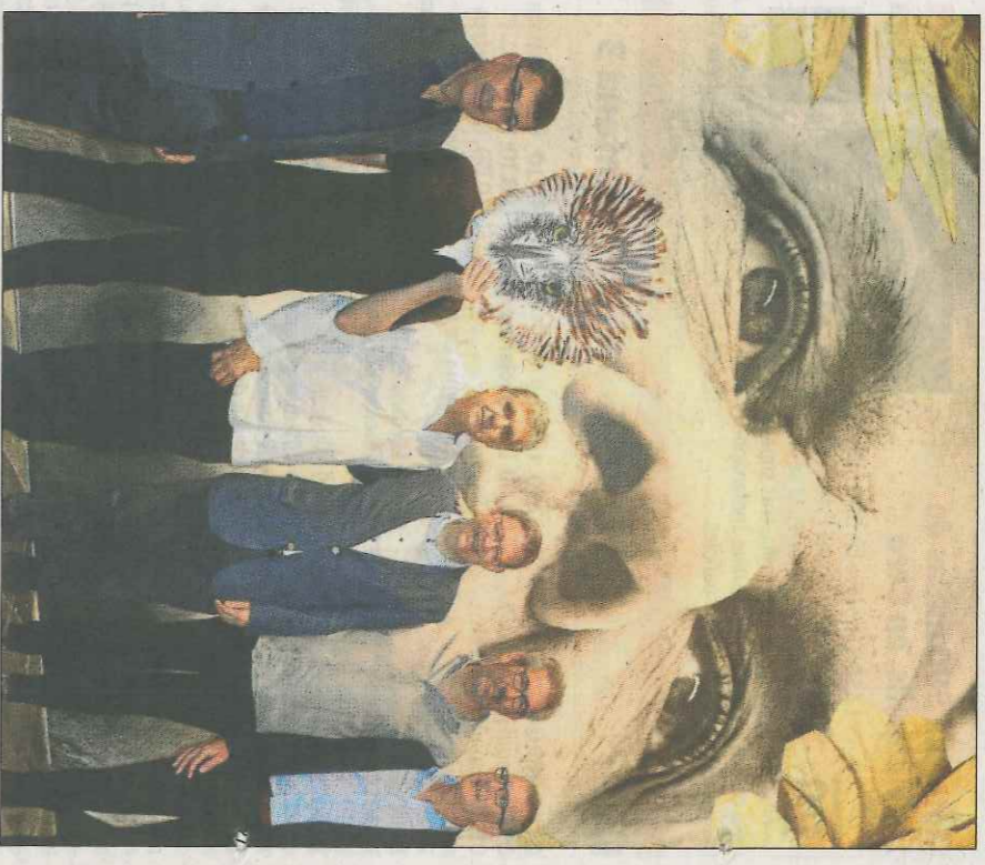
Autors i autoritats amb El Genovés davant d'una imatge del mite. VM