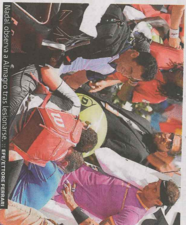
Nadal observa a Almagro tras lesionarse.