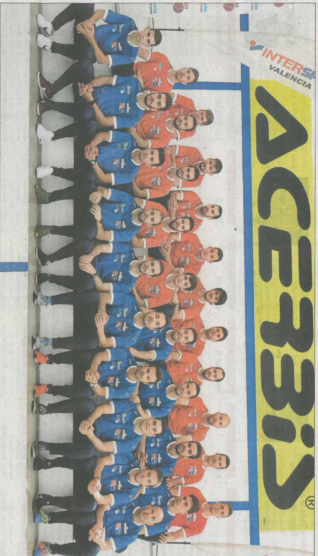
Els pilotaris professionals del raspall i l'escala i corda amb les noves equipacions, ahir en el trinquet de Pelayo. VAL NET