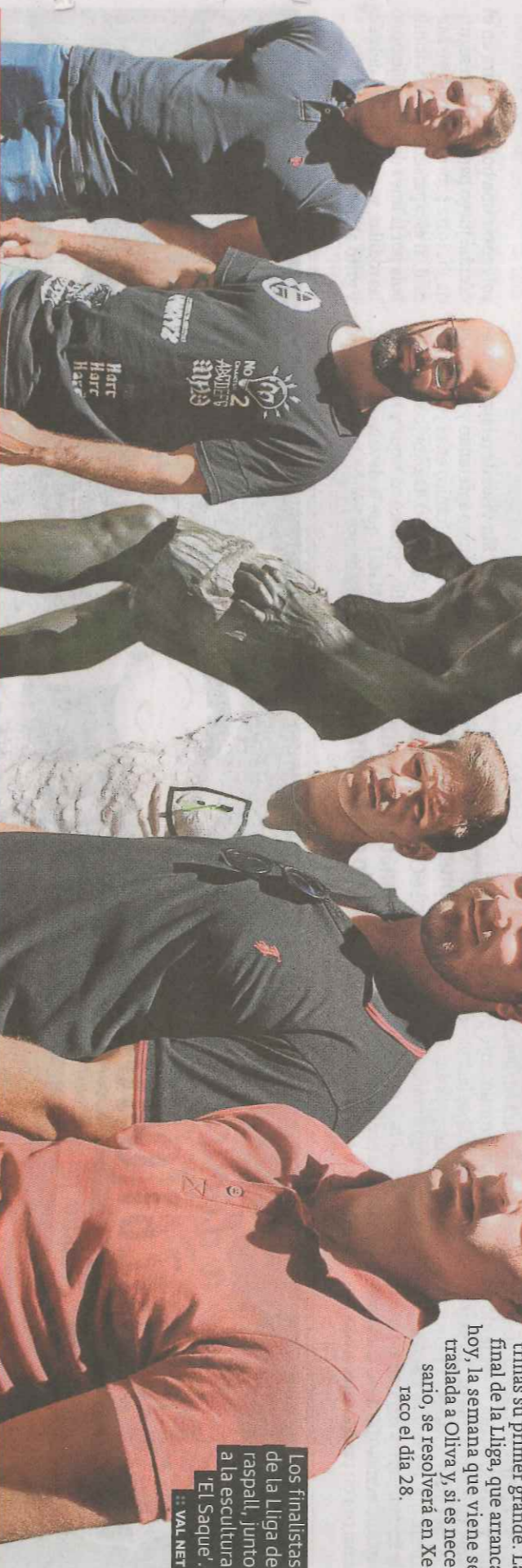
Los finalistas de la Liga de raspall, junto a la escultura 'El Saque'.