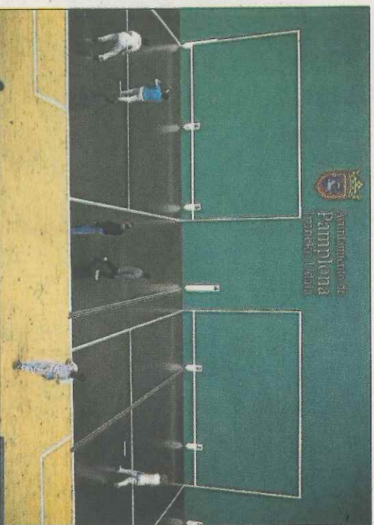
Canchas de Frontball en Pamplona.