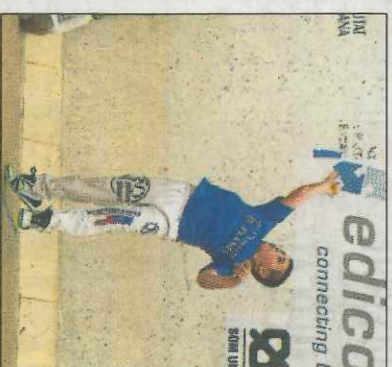
Xiquet de Massamagrèl. SD

Les fases finals Autònòmiques dels XXXV JECV d'escala i corda es tanquen aquest cap de setmana a Massamagrèl i la Poba de Vallbona. A Massamagrèl, es jugarà la competició de benjamins hui dissabte a partir de les 19:30 hores, on estaran presents els millors quatre equips d'aquesta temporada: On-