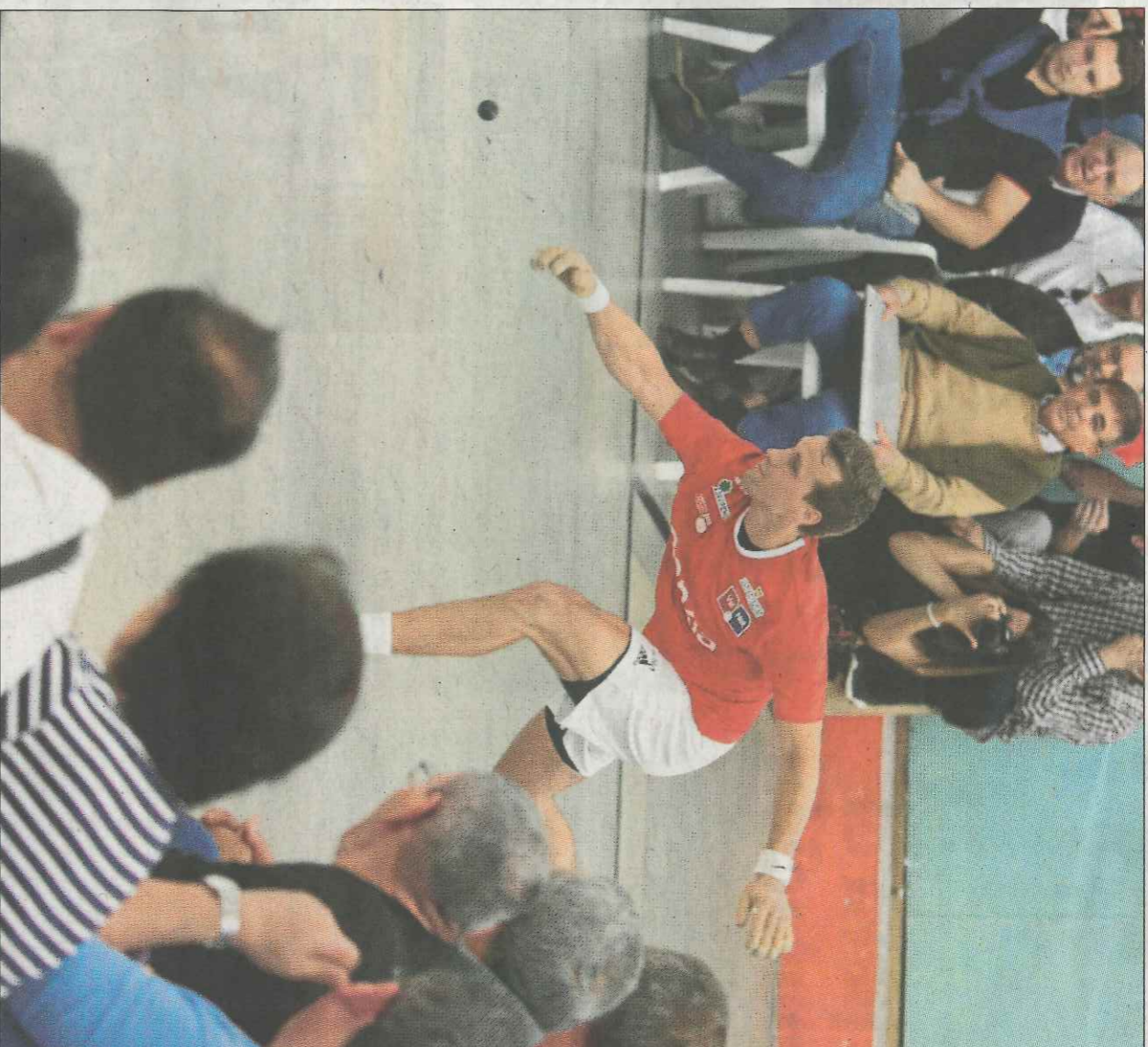
La Liga és l'únic títol que li queda per aconseguir al número u, Moltó. VAL. NET

Els components dels dos equips també van assenyalar en la presentació de la final que una de les tasques fonamentals serà intentar que els mitgers es convertisquen en es-