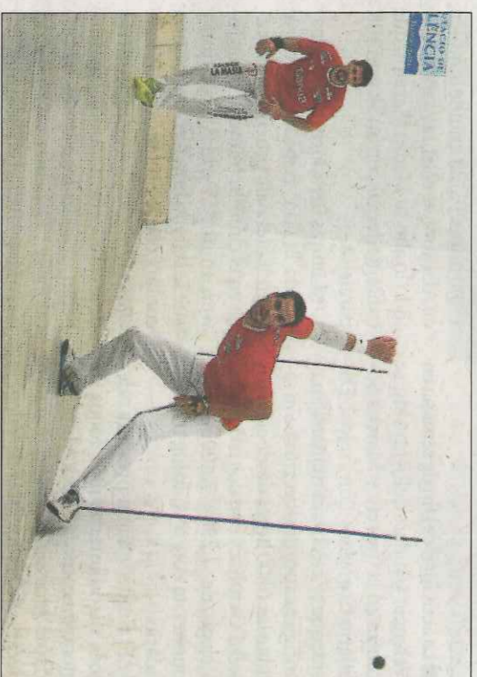
Soro III i Javi formaran hui amb colors diferents. VN

La sessió en el trinquet de Pelayo començarà a les 16.30 hores amb la final de la Liga Promeses Caixa Popular. Jesús i Carlos s'enfrontaran a Yago, Pablo i Luis Miguel.