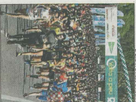
EE/JUAN CARLOS CÁRDENAS

■ La Volta a Peu a Valencia presentó ayer su 35ª edición -la 63 según la era antigua-, que tendrá lugar el próximo domingo 21 de mayo, con un trayecto que empezará y acabará en el Paseo de la Alameda. A falta de ocho días para la celebración de la prueba, la organización apuntó que ya se han superado las 6.000 inscripciones de los 15.000 dorsales puestos a la venta de forma presencial y, como novedad, online. El presidente de la SD Correcami-