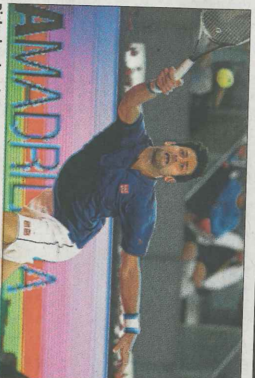
Djokovic golpea la bola en su partido ante Feliciano.

Mientras Murray hizo las matemáticas, Djokovic reforzó su confianza. El serbio sabe que nada mejor para preparar París o ganar cualquier torneo sobre tierra que vencer a cuantos más españoles le salgan al paso. El miércoles escapó de Nicolás Almagro, cuando el de Murcia le dominaba por 3-0 en el último set, y ayer a un excelente sacador como Feliciano López, que no tuvo su día con su mejor arma. Djokovic se enfrentará con Nishikori. A Coric y al