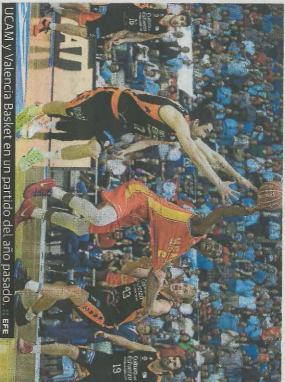
UCAM y Valencia Basket en un partido del año pasado.

La derrota en la jornada de ayer del Barcelona Lassa ante el Iberostar Tenerife retira a los catalanes de manera definitiva de la lucha por las dos primeras posiciones de la clasificación de la liga ACB.