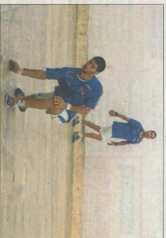
Ricardet i els seus companys ocupen la quarta posició en la taula. VN

Una vegada concretats els encreuaments faltaria saber on va cada semifinal, si a Genovés (divendres que ve) o a la Llosa de Ranes (dissabte 6 maig). Els trinquets s'adjudicaran per sortejig el dimarts.