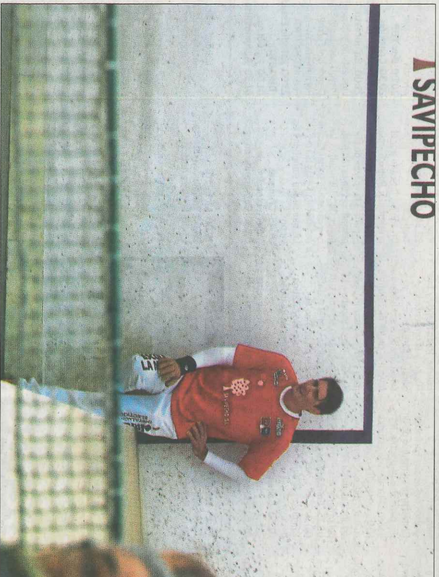
Soro III juga esta vesprada al trinquet de Massamagrell l'única partida abans de la gran final. VMI