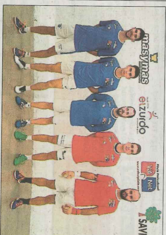
Presentació ahir de la partida a Bellreguard.

Esta setmana la Liga es jugarà als trinquets de Xeraco, Guadassuar, Piles i Pelayo