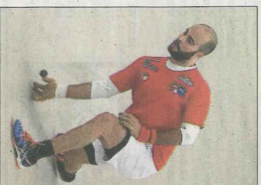
Brisca jugarà el divendres 30. WM

Esta activitat es mantindrà fins que acabe juny. En juliol i agost, com que són els mesos vacacionals per excel·lència, la periodicitat no