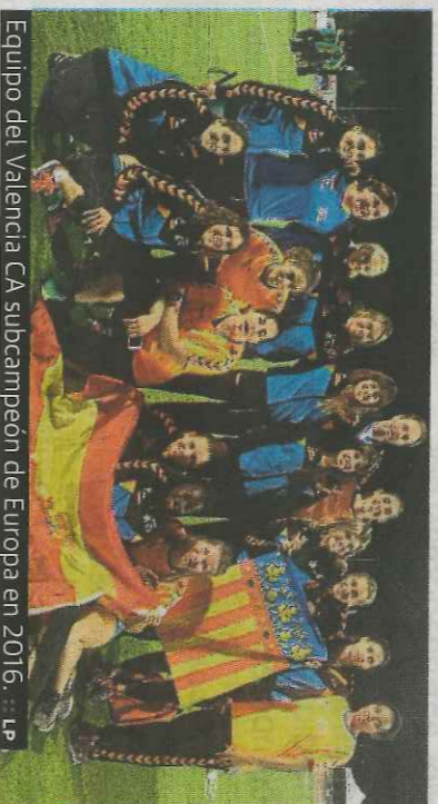
Equipo del Valencia CA subcampeón de Europa en 2016.