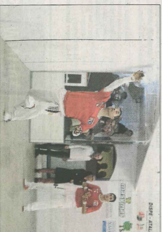
Se'n va un dels mitgers més importants de l'últim quart de segle. ▼▼