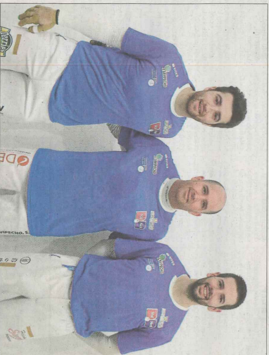
L'equip de Benidorm, Pere Roc II, Félix i Monrabal, primer finalista de la Lliga d'escala i corda. VN

Un resultat que deixa la lliga molt igualada. Cap equip ha guanyat, de moment, dues partides.