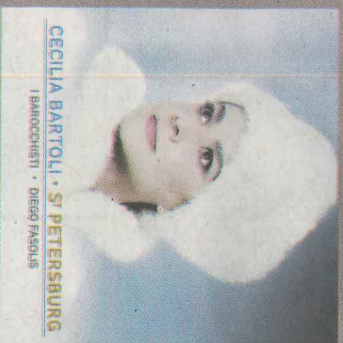
CECILIA BARTOLI • ST PETERSBURG I BAROCCHESTRI • DIEGO FASOUS

COMPROMETIDOS CON EL ACCESO A LA MÚSICA PARA TODOS LOS PÚBLICOS