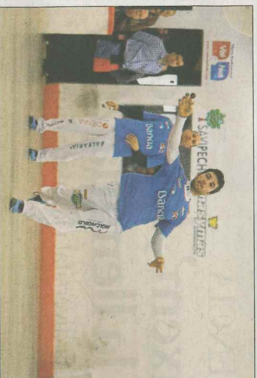
Monrabal va ser determinant en la primera partida a Guadassuar. VN

Solament hi ha un aspecte que podria ser més favorable al trio de