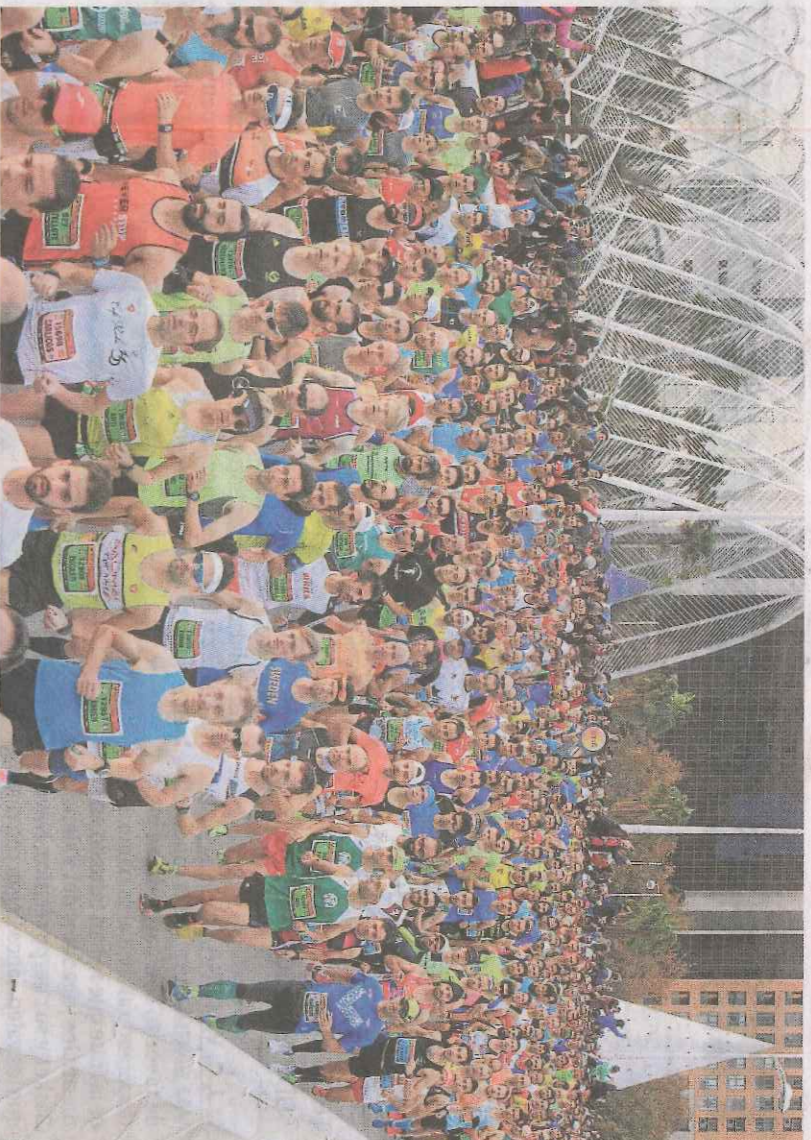
Cientos de corredores, instantes después de iniciar el Maratón de 2016.