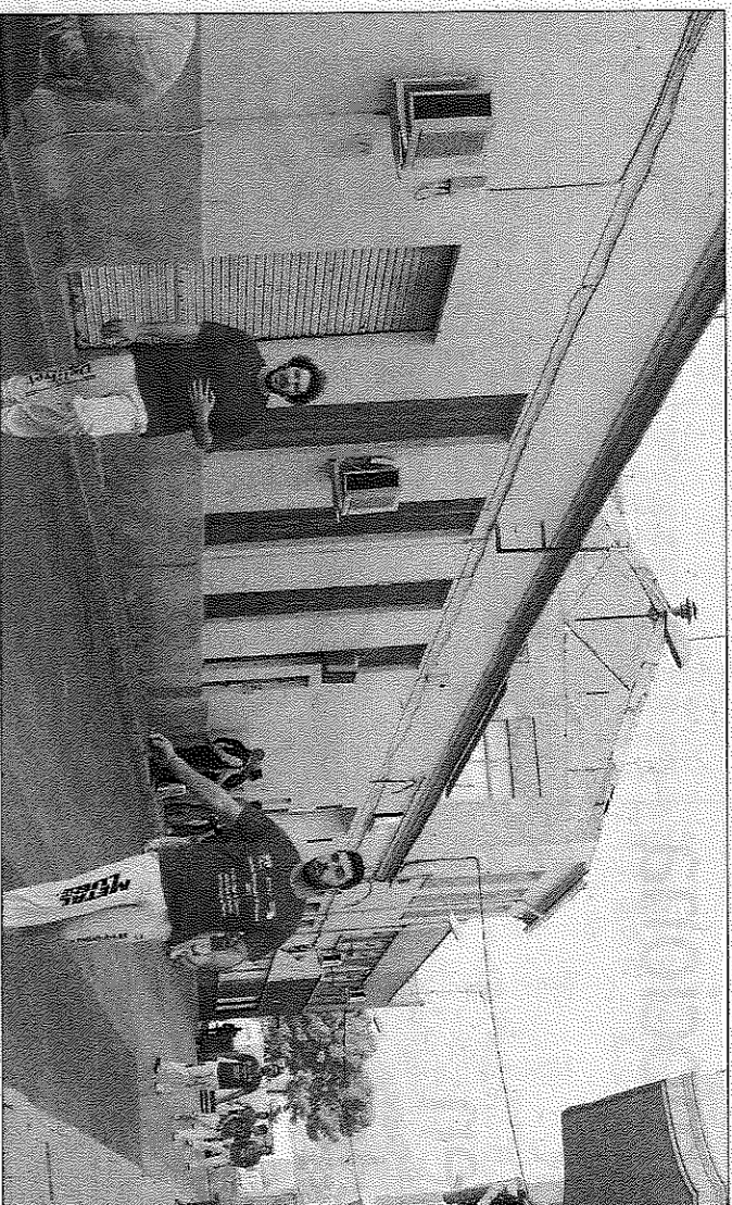
Calle de Petrer donde se juegan las partidas de llargues, con el taller en la parte izquierda.

En este sentido, los servicios mejor valorados por el corredor, tras su experiencia de correr la primera prueba Etiqueta Oro de la IAAF en suelo español, fueron la entrada a meta en la Ciutat de les Arts y les Ciències, el recorrido de la prueba y los 196 puntos de animación en el trazado por las calles de la capital el Túria.